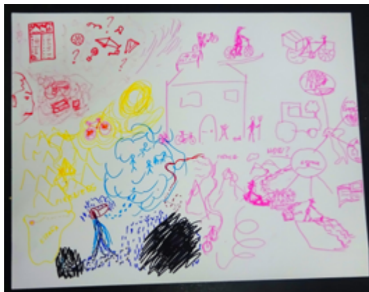
Imagen 5 • Cartografía de L.

L., tuvo necesidad de contar varias cosas a través de su dibujo. En el borde izquierdo, un poco más arriba de la mitad, lo empezó con un portarretrato de su perfil. Parecía como si desde allí estuviera viendo (o reviviendo) todo su viaje. Salió de Italia, pasó por Francia hasta llegar a España. Se observaba un momento difícil. “La emoción no