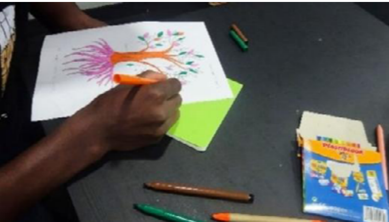
Imagen 2 • Ejercicio sobre el árbol.

y aunque el español fue el que permitió la comunicación entre todos, cada uno lo hablaba de manera diferente, por lo tanto, lo escribía también diferente. Las escrituras no fueron solamente poner en texto los monólogos de cada participante, sino dibujar sus mapas de viaje con colores, con trazos e imágenes particulares. Fue también señalar en un árbol sus raíces, su presente que les sostiene, su futuro sobre las hojas y ramas que van hacia arriba. Escribir sus historias fue también inventarlas a partir de objetos importantes para ellos; fue inventar, entre todos, los personajes, los lugares, los momentos; fue intentar responder preguntas sobre sus viajes para que entre todas esas voces se pudiese crear una coralidad.