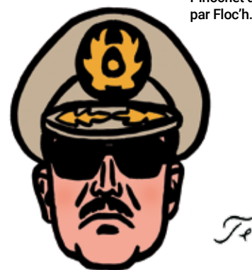
Pinochet dessiné par Floc'h.

Le Chili acquiert son indépendance en 1818 et évite la phase de caudillisme 1 que connaissent de nombreuses régions d'Amérique du sud, comme l'Argentine, à l'issue des processus d'émancipation de la couronne espagnole. Au contraire, les différents acteurs de la vie politique chilienne bâtissent au fil des années un système légaliste et pluraliste, forgeant ainsi l'image d'un pays démocratique aux yeux du monde.