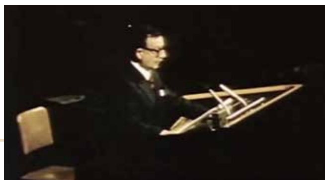
Salvador Allende à la tribune des Nations Unies en 1972.

https://www.youtube.com/watch?v=36mju8Hjejk (types d'images, scènes, organisation chronologique ou non des événements, son...)