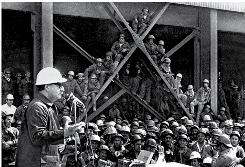
Le Bouton de nacre de Patricio Guzmán, 2015.