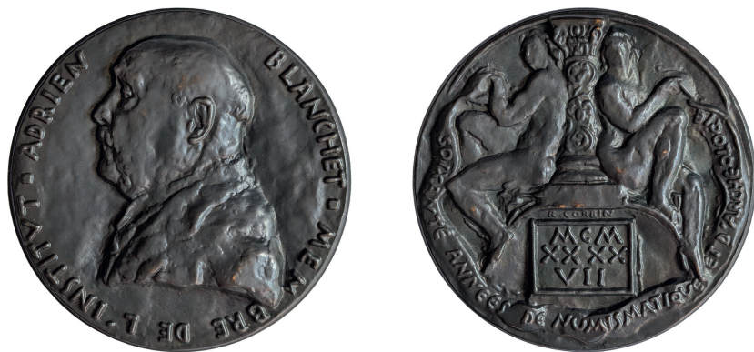
Figure 3 - Médaille offerte à A. Blanchet en 1947 (collection privée, cliché : M.-L. Le Brazidec).

Plusieurs types de souscriptions furent proposées en fonction des fontes ou frappes et des modules des médailles. Au droit de la médaille de R. Corbin (figure 3), on voit A. Blanchet de profil à gauche ; le revers représente les allégories de la numismatique et de l'archéologie adossées à une colonne, avec l'inscription 60 ANS DE NUMISMATIQUE ET D'ARCHEOLOGIE et le millésime 1947.