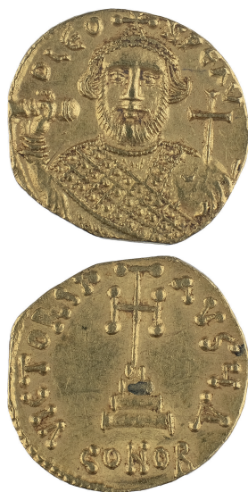
Figure 5 - Solidus de Léonce (© Michel Petit - CAGV ; x 2).