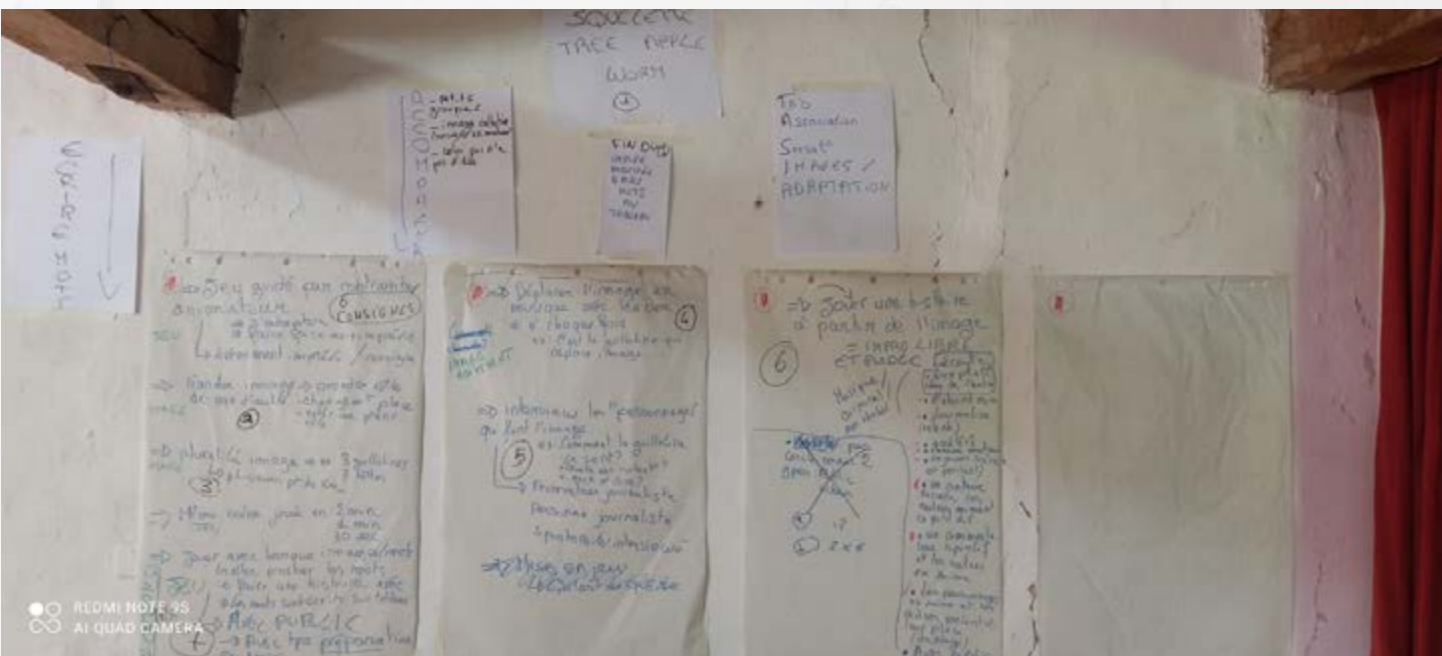
Squelette de la session consacrée à l'adaptation au travail, photographie prise par Claire Albert Lebrun

la pratique artistique, l'autre se nomme « jouer avec les émotions » et propose une série de jeux et d'exercices pour favoriser l'assertivité et la prise de parole en public.