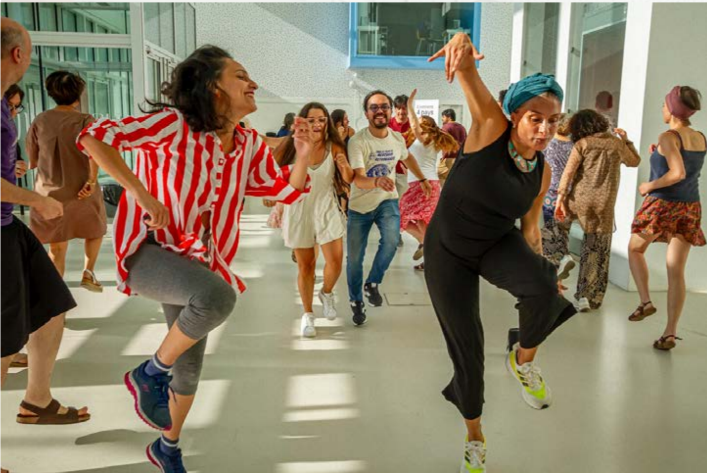
TransMigrARTS, juillet 2023, photo prise par David Romero (Université d'Antioquia)

A la Robin, les échanges ont toujours été nourris à la fois des expériences passées, de la pratique artistique et de la connaissance du public et du milieu ciblés, mais performer les exercices a été une méthode de recherche création constante au cours des trois jours : des allers et retours incessants entre pratique et théorie ont été le socle sur lequel l'innovation s'est construite. Cette forme de recherche création en théâtre appliqué, recherche intersectorielle et interdisciplinaire, est nouvelle dans le champ des arts vivants : elle ouvre une perspective infinie pour le théâtre appliqué à plusieurs domaines.