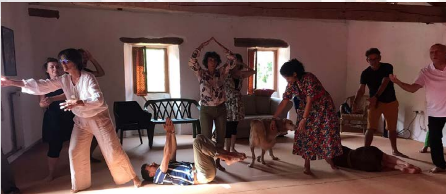
Machine-humaine du Manuel TASI

ques corporelles ont naturellement constitué un préalable à tout échange intellectuel, dans un écosystème de recherche qui l'applique peu et le légitime encore moins. Ce moment d'ouverture s'est finalement réalisé à l'instar de la dynamique d'un atelier qui porterait sur le bien-être, où une ouverture est primordiale pour que chacun.e se connaisse et prenne confiance dans le groupe et donc confiance en soi à travers le groupe pour libérer la parole et aborder par la suite les sujets délicats du bien-être au travail 4 . Cette séquence d'inclusion s'est conclue par la réalisation collective d'une machine humaine symbolisant l'objectif du séminaire de la Robin, à savoir créer un Manuel de théâtre appliqué au service du bien-être au travail.