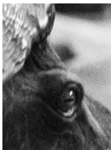
Figure 4. – Une image non retouchée

permet à l'utilisateur d'entrer lui-même les coefficients des noyaux des filtres qu'il désire, il s'avère que retoucher une image I (Figure 4) avec le filtre de noyau F (Figure 5), puis avec le filtre de noyau N (Figure 6), loin de ramener à l'image initiale I , produit une image de moindre qualité que I (et même moindre que celle de l'image floutée F * I ). Comment expliquer ce paradoxe ?