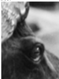
Figure 5. – Image floutée avec F

On peut imaginer un scénario d'AER où le professeur commencerait par expliquer qu'il a cherché à améliorer la netteté d'une de ses photographies au moyen du logiciel GIMP et que, pour cela, il s'est plongé dans une enquête personnelle. Le professeur présente rapidement le logiciel GIMP et la notion de filtre, il explique que selon lui les matrices N et F , pour des raisons qu'il ne détaille pas, devraient produire des effets opposés sur une image, ce qui permettrait de disposer d'un outil pour retoucher les images floues.