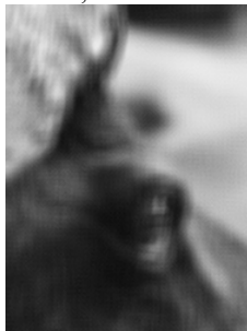
Figure 6. – Image floutée « défloutée » avec N

m'aider à déflouter l'image (Figure 5) que j'ai floutée ? ». La tâche ✓ que rencontrent les étudiants est alors la suivante : aider le professeur à déflouter l'image qu'il a floutée. La réalisation de cette tâche va les conduire à réaliser la tâche t^* : trouver une matrice de convolution dont le produit par la matrice F donne une matrice dont l'effet par convolution sur une image donnée est neutre. Enfin, cette tâche conduit à la rencontre et l'exploration du type de tâches enjeu de l'étude, T_{inverse} .