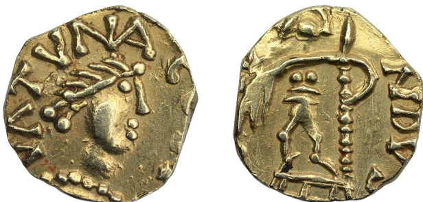
Figure 3 - Tremissis du trésor de Lucy, de l'atelier de Granat, inv. 696.12 (© Musée-Métropole-Rouen-Normandie ; clichés : Yohann Deslandes ; × 2).

En 2020, le spécialiste des monnaies mérovingiennes Arent Pol avertit le musée de la mise en vente d'une pièce sortie de la collection avant 1956 dans des circonstances mal élucidées (figure 3). Par la suite, elle se trouva au musée du Havre, où elle fut volée vers 1966. Par une heureuse négociation, cette pièce put réintégrer les collections du musée en 2021. Il s'agit d'un tremissis frappé à Gannat (Allier) et issu d'un ensemble de premier ordre, à savoir le trésor de Lucy, composé de cinq exemplaires qui furent découverts en 1851 lors des fouilles d'un cimetière mérovingien par l'abbé Cochet, pionnier de l'archéologie mérovingienne en France et plus tard conservateur du musée 22 .