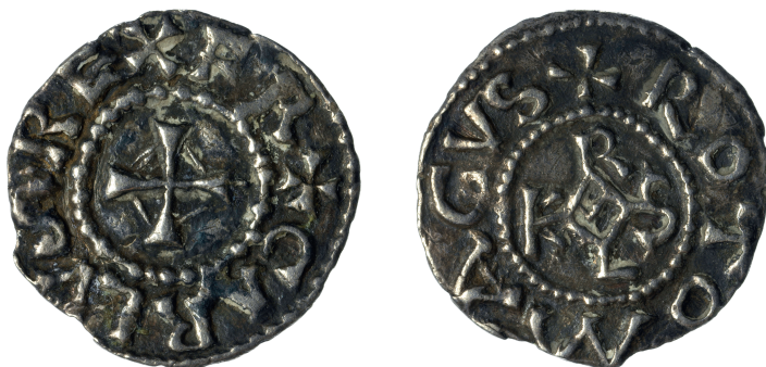
Figure 2 - Denier de Charlemagne frappé à Rouen, inv. 2011.1.1 (© Musée-Métropole-Rouen-Normandie ; clichés : Yohann Deslandes ; × 2).

Le Cabinet de numismatique, fort de ses 13 000 exemplaires, reste actuellement un composant actif du MDA. La politique d'acquisition se poursuit. À titre d'exemple, en 2011 fut acquis le très rare denier de Charlemagne frappé à Rouen entre 793 et 813 (inv. 2011.1.1) (figure 2). Deux trésors importants de la guerre de Cent Ans, découverts respectivement en 2012 et 2016, sont entrés au MDA 21 . Ils ont été déclarés au Service régional de l'Archéologie, qui, après l'étude scientifique, a dirigé les propriétaires vers le musée. Il s'agit des 943 pièces et quatre anneaux du trésor d'Oissel, enfoui entre mai et octobre 1417 (inv. 2015.1.0) et des 333 pièces du trésor de Quincampoix, enfoui entre 1433 et 1449 (inv. 2019.1.0). L'intérêt de ces ensembles ne réside pas dans chaque pièce individuellement, la plupart étant relativement communes, mais dans leur association dans un ensemble qui constitue un instantané de la masse monétaire circulant au moment de l'enfouissement. Cela dit, certaines pièces rares sortent du lot, notamment le demi-guénar frappé au nom d'Henri V à Rouen en 1419. Il s'agit du second exemplaire connu, le premier l'étant seulement par un dessin du XIX e siècle.