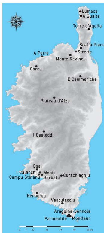
1. Carte de localisation des sites archéologiques cités dans le texte © Hélène Paolini-Saez

Aux matières argileuses locales, nous avons remarqué l'ajout de microscopiques fragments de vases cassés (fig. 2). Ces fragments, appelés « chamottes », se rattachent soit à un marqueur culturel d'identification, soit à un critère technique utilitaire. On les retrouve au Néolithique ancien à Strette et Araguina-Sennola, au Néolithique moyen au Monte Revincu et à l'âge du Bronze et du Fer à I Casteddi et E Cammeriche 6 .