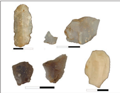
4-1 : Échantillon de silicite évaporitique prélevée sur le gîte de Pantalinu (bassin de Perfugas, Sardaigne).

La place du silex s'effondre au Néolithique moyen. Il représente moins d'1 à 11 % des industries lithiques étudiées, soit de 2 à 240 pièces. Ce changement est beaucoup plus significatif pour les séries du Sud de la Corse, où les importations pouvaient être massives (plusieurs milliers de pièces) au Néolithique ancien. L'évolution par rapport à la période antérieure est nette également du point de vue des faciès puisque les types « calcédonieux » deviennent prépondérants (gris, blancs translucides, fig. 4-2). Leur provenance est toujours rapportée à la Sardaigne, mais on retrouve ces faciès à la fois dans le Nord de l'île (Perfugas) et dans le Sud (massif du Montiferru). L'hypothèse privilégiée est celle d'une importation du massif de Montiferru, avec une introduction qui suivrait les réseaux de diffusion de l'obsidienne. Des caractérisations plus poussées sont en cours