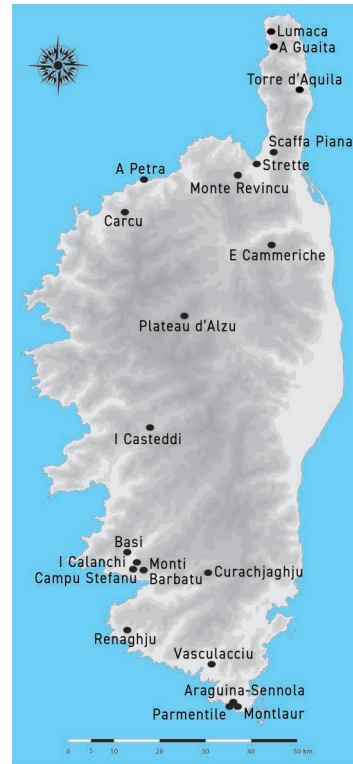
1. Carte de localisation des sites archéologiques cités dans le texte © Hélène Paolini-Saez

Aux matières argileuses locales, nous avons remarqué l'ajout de microscopiques fragments de vases cassés (fig. 2). Ces fragments, appelés « chamottes », se rattachent soit à un marqueur culturel d'identification, soit à un critère technique utilitaire. On les retrouve au Néolithique ancien à Strette et Araguina-Sennola, au Néolithique moyen au Monte Revincu et à l'âge du Bronze et du Fer à I Casteddi et E Cammeriche 6 .