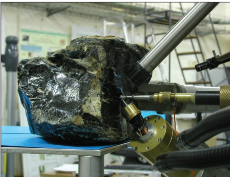
4-3 : Bloc d'obsidienne du site de Teghja di Donna (Sotta, Corse-du-Sud) analysé par PIXE avec l'Accélérateur Grand Louvre d'Analyses Élémentaires (AGLAÉ)