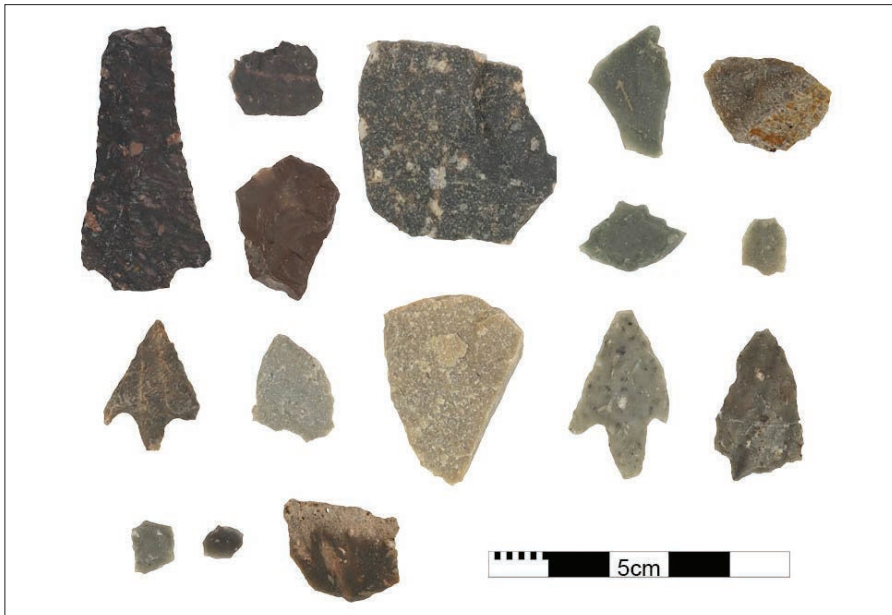
3. Exemple d'artefacts en rhyolite mis au jour sur le site de Basi (Serra di Ferro, Corse-du-Sud)

En Corse-du-Sud, au Monti Barbatu (Olmeto), du Néolithique récent jusqu'au Bronze moyen, les populations ont utilisé majoritairement des gisements de rhyolite locale avec une prédilection pour la fabrication d'outils pondéreux à la Protohistoire. Sur d'autres sites, comme Renaghju (Sartène) et Basi 12 , l'utilisation de plusieurs matières locales est confirmée, complétée faiblement par des rhyolites du Nord (fig. 3).