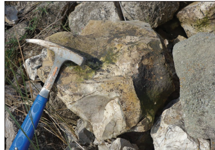
4-2 : Silex de Vasculacciu aux faciès calcédonieux. (Figari, Corse-du-Sud)