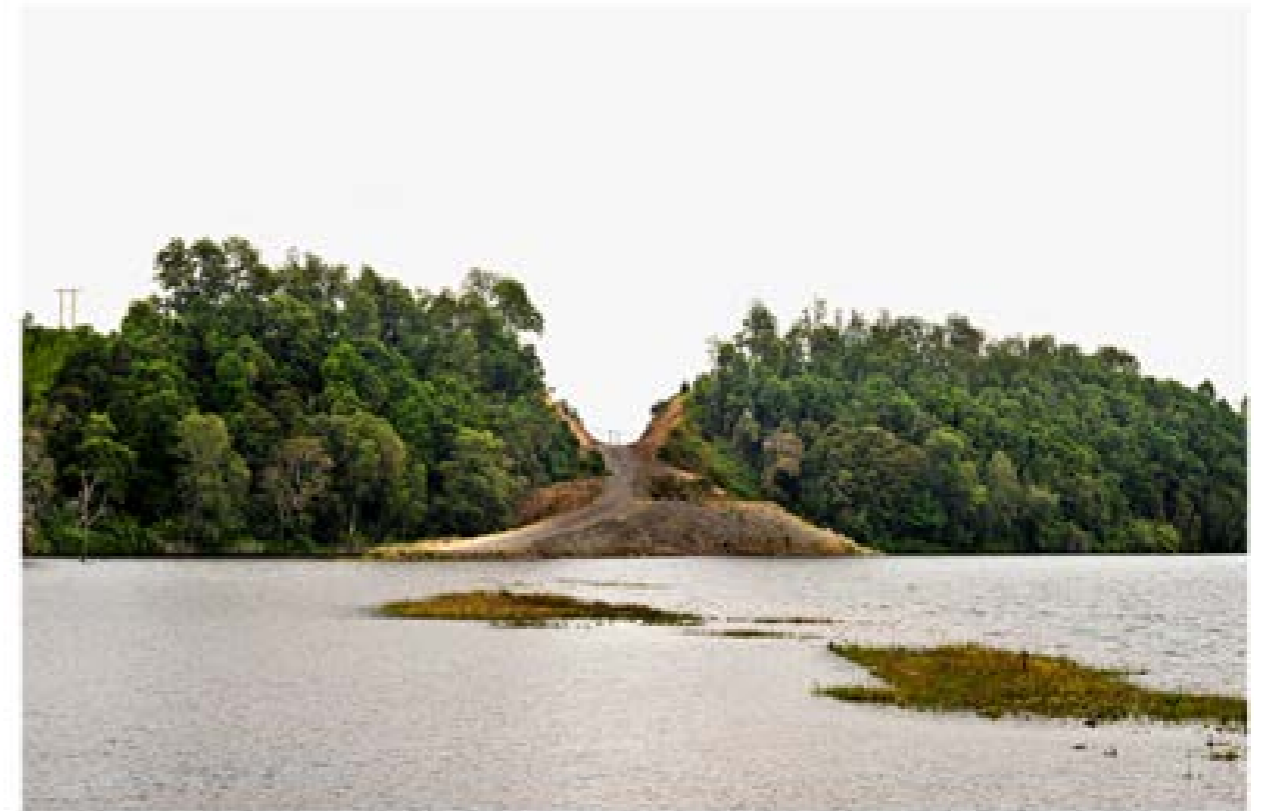
Fotografía · Gustavo Miranda, «Afpumapu», 2016. Frontera mapuche, Región de la Araucana, Chile.

ra. Los muros invisibles son las fronteras que nos ponemos nosotros mismos al llegar a otro lugar, a otra tierra a otra cultura; lo que representa políticamente y socialmente migrar. Son los miedos a lo desconocido, a aprender otra lengua, a alejarte de tus raíces, a vivir en otra cultura, por sobre todo, estos muros invisibles son el miedo y las dificultades que encontramos al enfrentarnos a las políticas migratorias que cada país establece y que muchas veces, son bruscas e injustas. Muchas veces, crean en nosotros muros invisibles «engañosos, muros perversos, muros traicioneros».