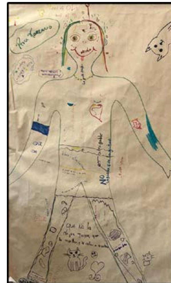
PERAMANZANA, el día de su nacimiento