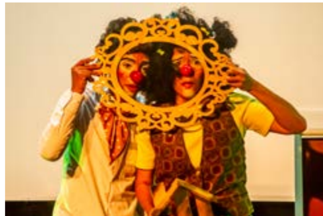
Foto: Presentación de los payasos Coco y Chocozeuela en el auditorio

La propuesta de socialización del TIAP se caracterizó por una gran diversidad de productos y prácticas artísticas como fue el caso en el diseño del mismo taller: músicas, clowns, improvisaciones, cantos, teatros, performances, audiovisuales, artes plásticas, instalaciones, escrituras, rituales. A la manera de una cosecha, el material compartido públicamente durante la socialización contó con objetos, imágenes, videos, textos, gestos que se dieron durante las diferentes sesiones anteriores del taller. La selección que hicieron las participantes para compartir al público entre todas las prácticas y productos del taller tiene principalmente que ver con los criterios siguientes: