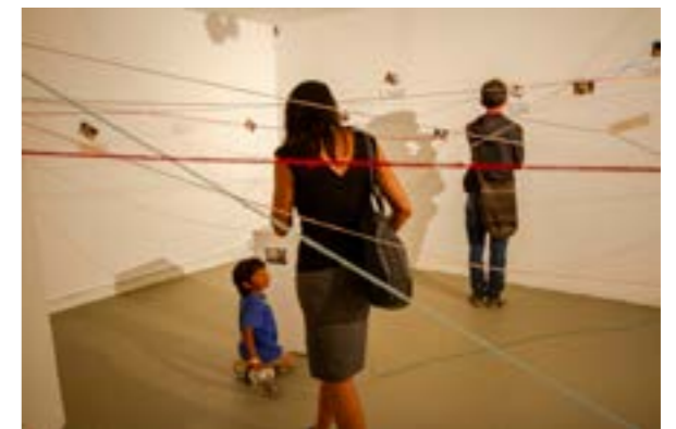
Foto: Instalación con tejido de hilos en la sala de exposición

En términos generales, podemos decir que la socialización visibilizó la solidaridad entre las participantes, tanto en cuanto a la preparación logística de la socialización y el espíritu colaborativo para lograr tal evento, como en cuanto a la expresión artística por ejemplo con las canciones, los performance y los textos que presentaron en gran parte juntas, o más sensiblemente por la cercanía física y emocional que mostraron entre ellas. Por lo que nos contaron después de la socialización, las participantes siguen puntualmente apoyándose entre sí, encontrándose y trabajando juntas en diferentes capacitaciones como líderes de sus comunidades. Las talleristas en sus entrevistas nos comentaron que tienen expectativas sobre los vínculos entre las participantes como apoyo para llevar lo que aprendieron a sus comunidades y a seguir o hacer cambios en su vida y en la vida colectiva del país.