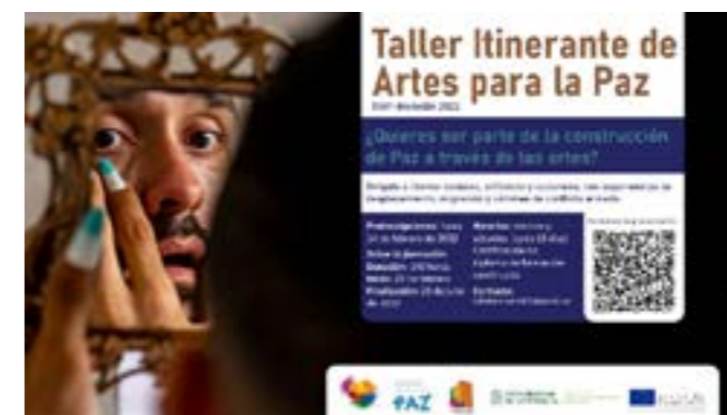
Foto: Convocatoria del TIAP 2022 UDEA