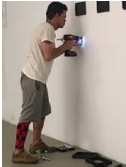
Foto: Instalación colaborativa en la sala de exposición-© David Romero

larmente significativa a lo largo de los seis meses del TIAP, sentimos una ola de emoción muy fuerte en el escenario. En este mismo sentido, en las entrevistas que hicimos con las participantes una semana antes de la socialización, se mencionaba de manera recurrente la posibilidad para esas dos personas de mostrar sus debilidades y contar sus historias dolorosas, sabiendo que el grupo podía contener y aceptar estas historias.