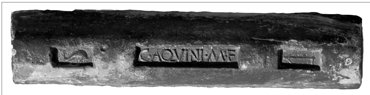
Fig. 3. Lingot de plomb provenant des fouilles sous-marines effectuées en 1997 au voisinage de l'îlot d'Escombreras, près de Carthagène. Il porte l'estampille de C. Aquinius M.f. (cl. C. Domergue 2002).

gots d'étain et pour les barres de fer, où les traces de plomb sont infimes. Par ailleurs, la méthode est efficace dans la mesure où l'on dispose d'une base de données aussi pertinente, aussi riche que possible, adaptée enfin à la recherche de l'archéologue, ce qui signifie qu'elle doit tenir compte de données de l'archéologie minière 3 .