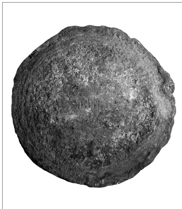
Fig. 2. Lingot de cuivre provenant des Riches Dunes (Marseillan, Hérault).

Pour les lingots de cuivre, l'apport des méthodes classiques a été moindre. Il y a longtemps que la forme la plus fréquente – lingots dits « plano-convexes » – est considérée comme hispanique, en raison de ce qu'on savait, par les auteurs anciens, de l'importance des mines de cuivre d'Hispanie à l'époque romaine. Nous avons aussi vu plus haut que, grâce à l'identification des épaves métalliques