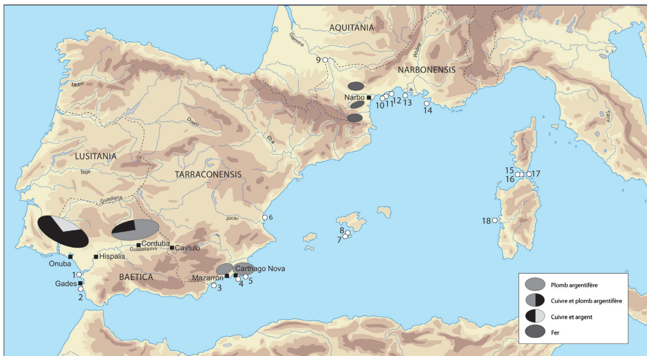
Fig. 4. Épaves et gisements sous-marins cités dans le texte : 1 - Chipiona . 2 - Pecio del Cobre . 3 - Aguilás . 4 - Escombres . 5 - Bajo de Dentro . 6 - Grau Vell de Sagunto . 7 - Cabrera 4. 8 - Cabrera 5. 9 - Golfech . 10 - Baie de l'Amitié . 11 - Riches Dunes . 12 - Maguelone . 13 - Saintes-Maries-de-la-Mer . 14 - Planier 2. 15 - Lavezzi 1. 16 - Sud-Lavezzi 2. 17 - Sud-Perduto 2. 18 - Mal di Ventre . En vignette, la nature des gîtes métallifères.