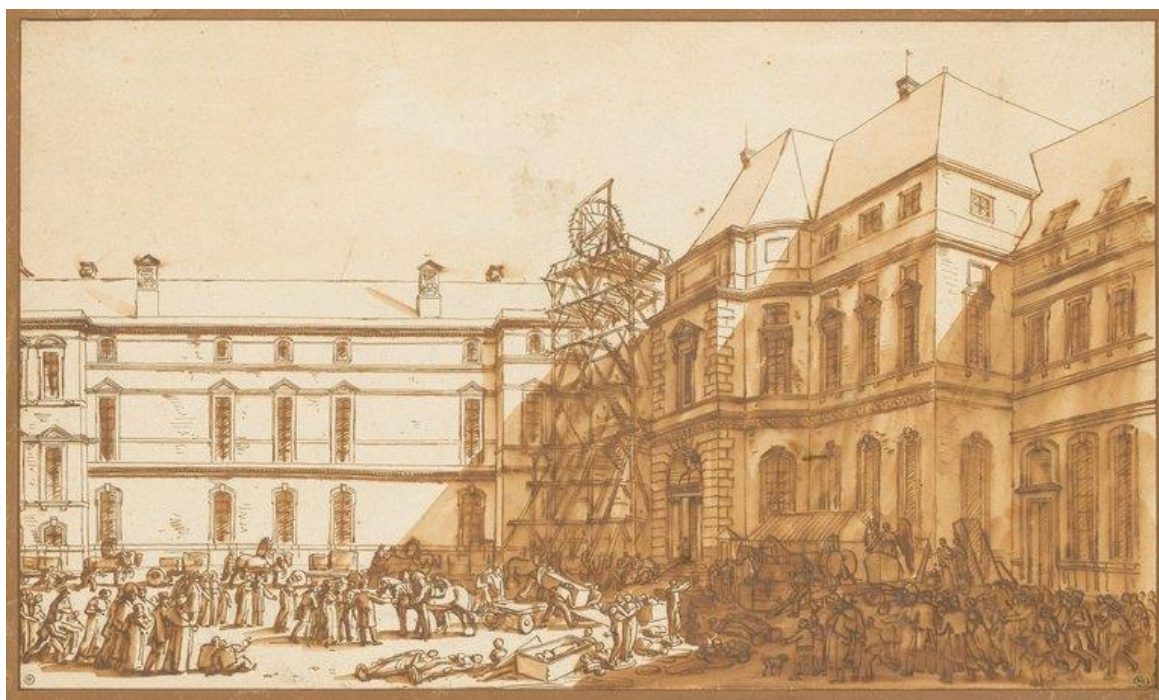
Benjamin Zix, L'arrivée au Louvre des trésors d'art de la Grande Armée plume et lavis à l'encre brune, vers 1808. Paris, musée du Louvre, Département des Arts graphiques, n° inv. RF 6061.

La découverte d'un dessin inédit de l'architecte Jean-Arnaud Raymond, projet non réalisé, vise à mettre en lumière deux zones du Louvre moins étudiées : ses entrées sous le Directoire puis le Consulat. De nombreux travaux ont décrit les aménagements intérieurs du Musée Central des arts puis Musée Napoléon, connus aussi par les vues peintes par Robert, Percier, ou Fontaine. L'arrivée au Louvre des trésors d'art de la Grande Armée , dessin de Benjamin Zix montrant l'activité des employés du musée fait office d'exception. Ici, Jean-Arnaud Raymond projeta – entre autres – d'intégrer les Chevaux de Saint-Marc, œuvres immensément célèbres que leur matériau, le bronze, vouait à une exposition en extérieur, ce qui n'était pas de cas de célèbres marbres. Ce projet finalement abandonné, plus complexe et couteux, paraît tout aussi intéressant que celui effectivement réalisé quelques années plus tard, à savoir l'installation en 1805 au-dessus de la porte du musée du buste de Napoléon I er par Lorenzo Bartolini visible sur le dessin de Zix. 1