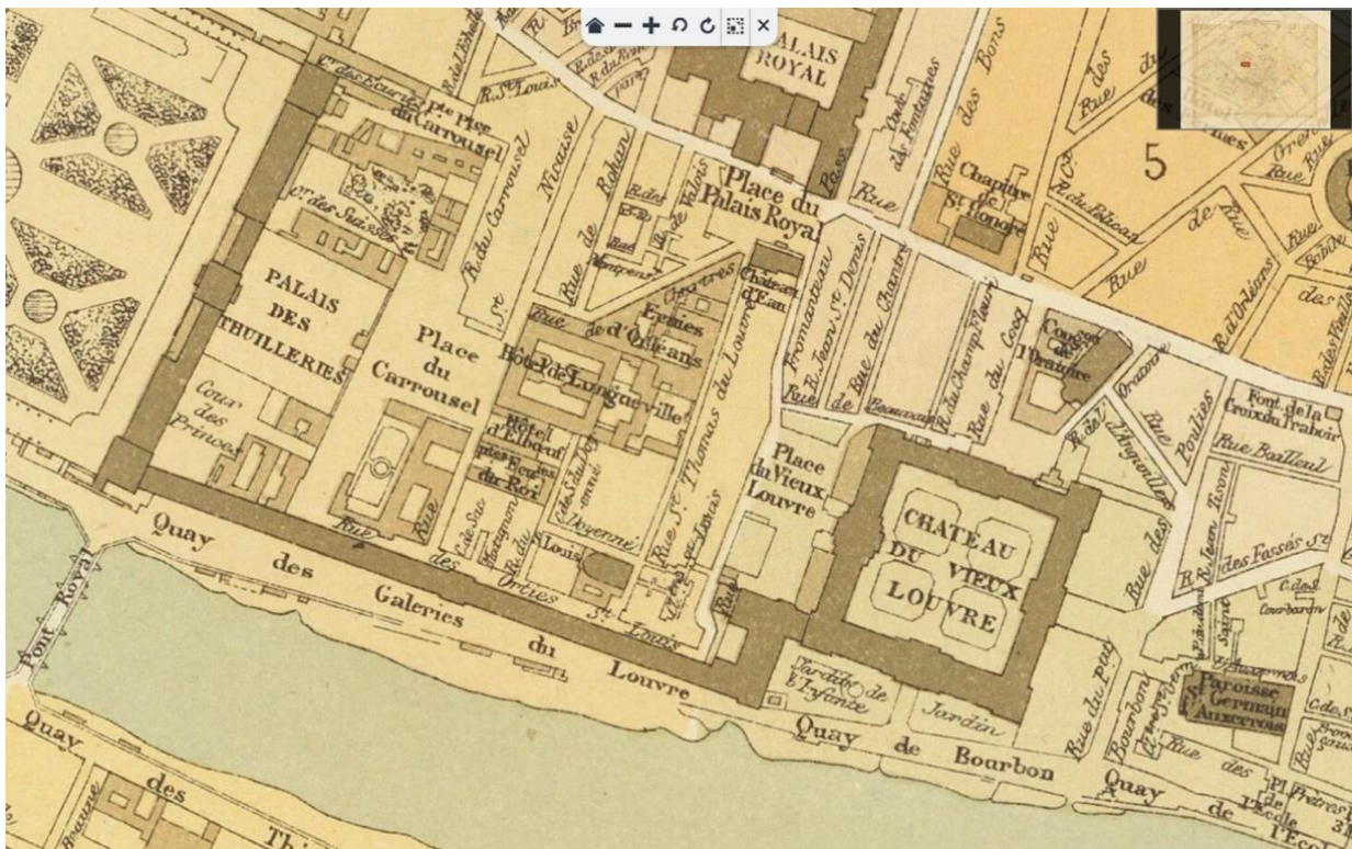
Détail du Plan de la ville de Paris en 1789 dressé... par M. Lucien Faucou. Situation du jardin de l'Infante, de la place du Vieux Louvre et de la rue Fromanteau.