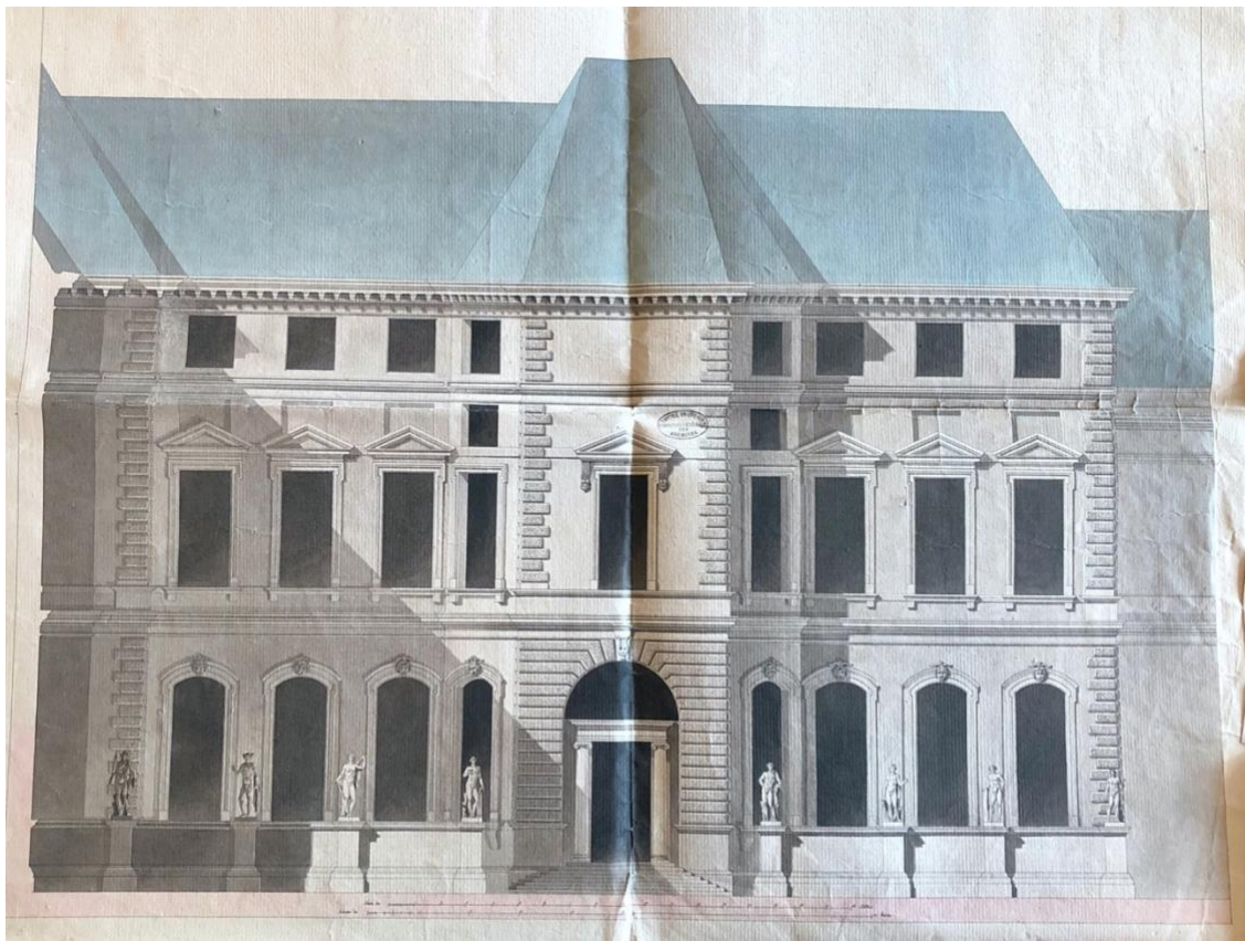
Feuille principale montrant le projet incluant « une suite de statues antiques ou copies de ces monuments ». (Plume et lavis colorés, L. 57 cm ; l. 46cm)