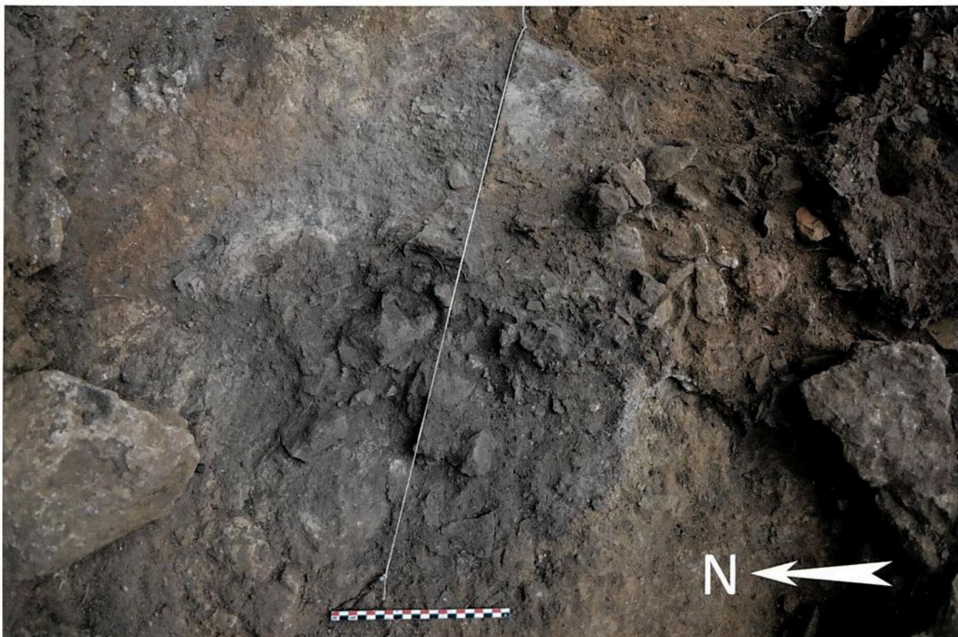
SAVIGNAC-DE-MIREMONT - Grotte de La Ferrassie Structure 110 en cours de fouille