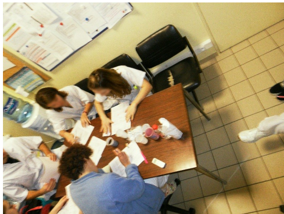
FIGURE 2 : Les transmissions (sans ordinateur) de l'infirmière du matin (de face et au centre de la photo) devant sa fiche et un post-it complémentaire (sous sa main droite), l'interne à sa droite et l'infirmière de relève de dos.