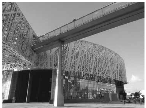
Architecture du Mémorial Acte.