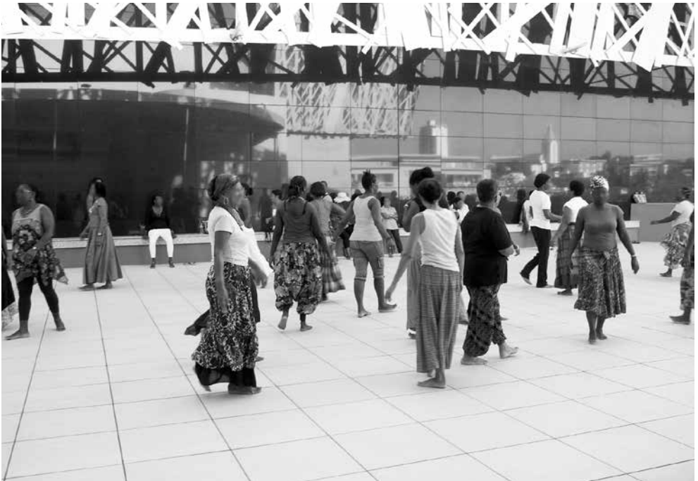
Scène de danse sur l'esplanade du Mémorial Acte.

Architectes : Pascal Berthelot, Jean-Michel Mocka-Célestine (atelier BMC), Michael Marton, Fabien Doré.