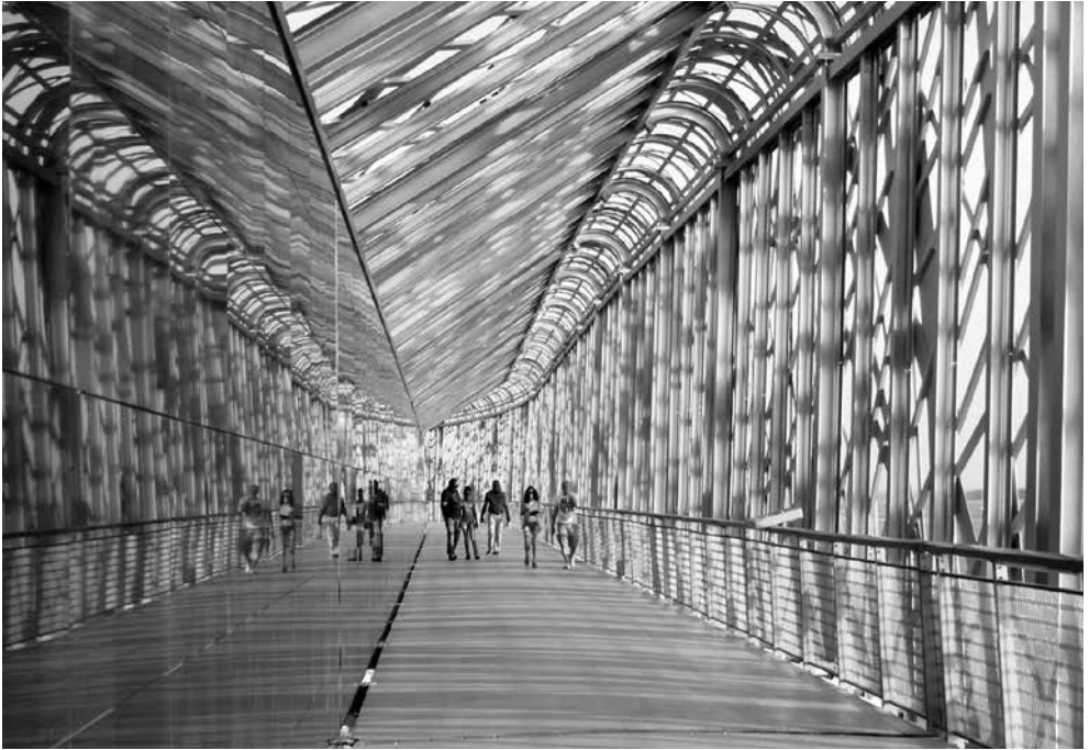
Passerelle du Mémorial Acte.