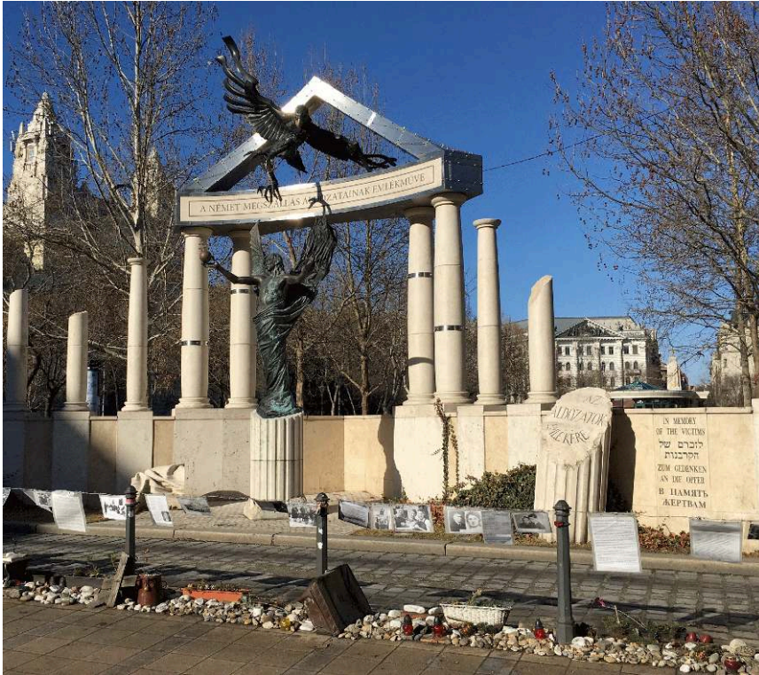
Szabadság tér à Budapest. Mémorial aux victimes de l'invasion allemande.

12 février 2017