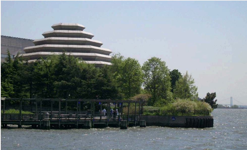
Museum of Jewish Heritage

2 janvier 2008