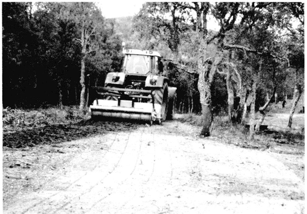
Fig. 2 – Ouverture mécanique de la zone A du site de Calmeilles

l'état structural de la végétation par une approche géosystémique. Le géosystème est un système mis en place pour étudier le complexe géographique naturel. L'analyse est plus étendue que la zone de suivi, les différents éléments du paysage pouvant être utilisés en complémentarité et supplémentation par les papillons. Nous nous intéresserons à la structure de la végétation, par l'intermédiaire des strates de végétation, l'impact premier de ces aménagements se situant à ce niveau.