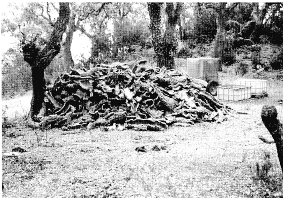
Fig. 3 – Zone débroussaillée de l'aménagement de Calmeilles (dans les Aspres) où le liège côtoie les points d'eau pour les vaches. Au premier plan : la ligne permanente pour le relevé de la végétation (cliché FR - 23 mai 2002)

Les zones C représentent le milieu d'origine, avant les diverses interventions pour la mise en place de l'aménagement. Elles montrent ainsi une dominance de recouvrement (67 %) par les chênes pour Calmeilles