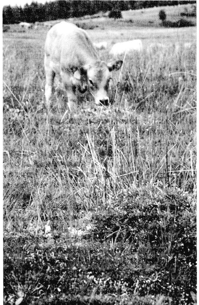
Fig. 5 – Un jeune veau de race Aubrac « émerveillé » par les curiosités d'une tourbière (Aubrac, été 2002)

Rares sont les tourbières ou les prairies humides qui constituent une parcelle de pâture à elles seules. Généralement, elles font partie d'un ensemble hétérogène beaucoup plus vaste de prairies. Aussi, pour chaque site, demande-t-on à l'exploitant les limites exactes de la zone de pâture contenant l'îlot humide. Les contours de la zone humide et de la parcelle, et le positionnement des clôtures de refends sont cartographiés. Cumulé au questionnaire que nous remplissons