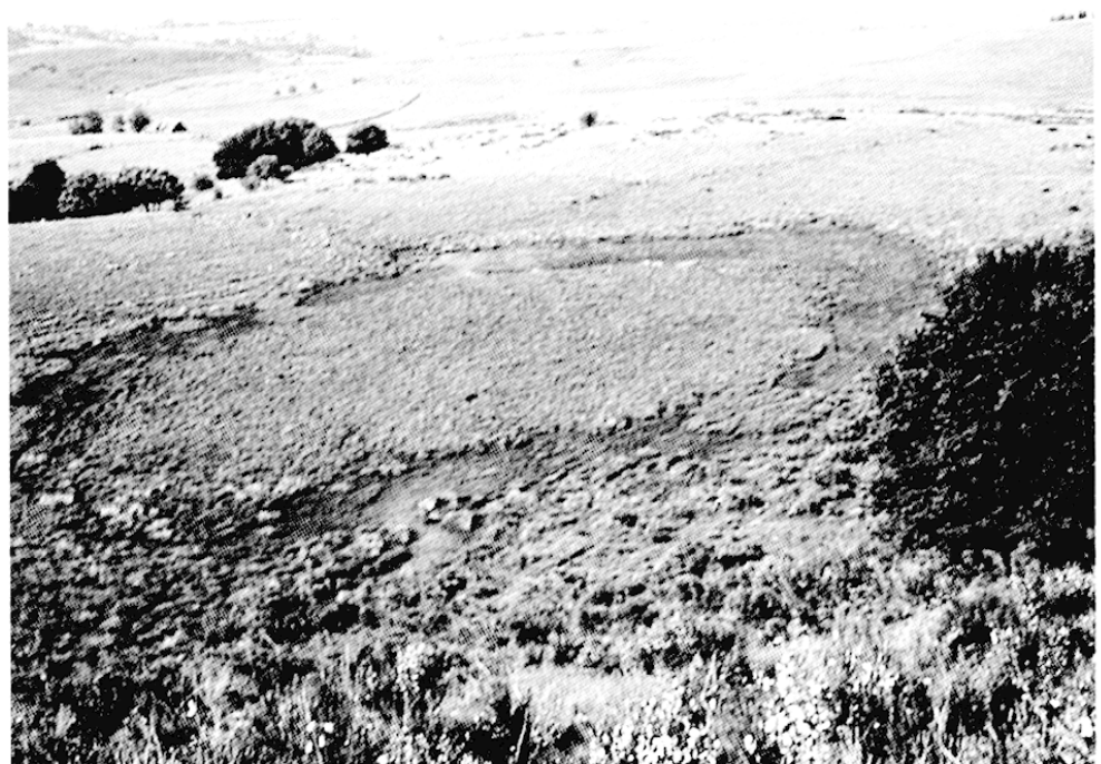
Fig. 3 – Tourbière de Prat Fangous (Aubrac)

agricole plus ou moins autarciques et étaient « entretenues » par le pâturage extensif, par la fauche estivale ou par le feu pastoral en automne ou en hiver afin d'obtenir de nouvelles pousses printanières et d'éliminer les refus. Dans ce système relativement autarcique, les seuls acteurs concernés sont les agriculteurs. Les paysans ont alors une connaissance et une reconnaissance culturelle de la valeur d'usage de ces tourbières.