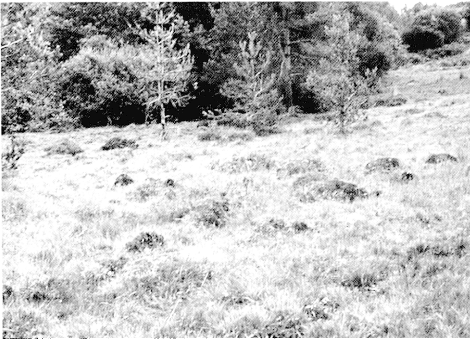
Fig. 6 – Gestion d'une tourbière : Saint-Julien de Fayret, 1996 (avant gestion)