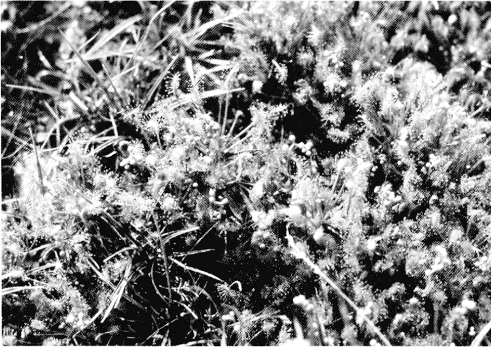
Fig. 4 – Droséra intermédiaire (Drosera intermedia)