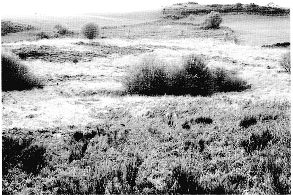
Fig. 2 – Tourbière d'Arvieu (Lévezou)

Les tourbières font alors l'objet de multiples usages: pâturage estival, fourrage, fauche des joncs pour la litière hivernale, chasse au gibier d'eau, pêche, cueillette, utilisation de certaines cypéracées pour le rempaillage de chaises, récolte des osiers pour la fabrication de paniers... Ces zones humides, privées ou communales, étaient donc totalement intégrées aux systèmes d'exploitation