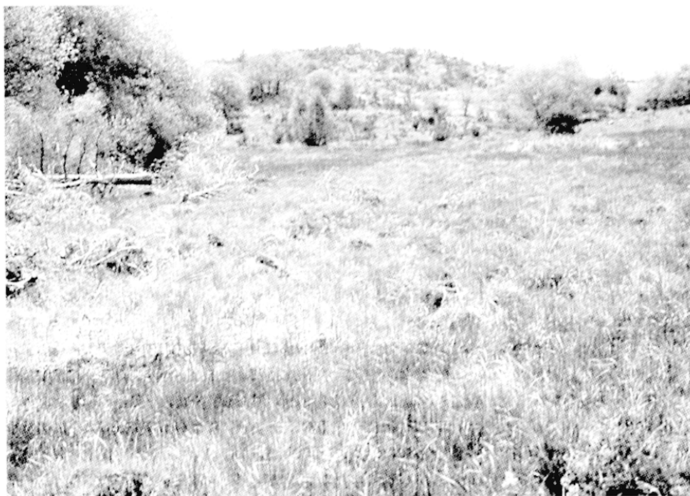
Fig. 7 – Gestion d'une tourbière : Saint-Julien de Fayret, 1997 (après gestion)

Aubrac plus fréquemment en face de faciès de sous-pâturage. En effet, en gestionnaires de l'herbe, les agriculteurs tiennent surtout compte du fourrage disponible hors zone humide. Les bêtes, quant à elles, se nourrissent préférentiellement (dans un premier temps du moins) en périphérie des zones humides. De ce fait, même avec des chargements annuels proches de 2 UGB/ha, certaines zones humides ne sont que relativement peu pâturées. D'où l'intérêt de connaître la part de « l'humide » dans « le sec » pour définir des chargements adaptés. Aussi, dans certains cas, hors périodes estivales marquées, le recours à des clôtures de refends s'impose et permet tout à la fois une pression de pâturage correcte sans pour autant avoir à diviser le troupeau ou à le faire séjourner plus de jours qu'il ne faut. À terme, après dépouillement, nous espérons pouvoir définir une fourchette fonctionnelle du chargement idéal en fonction de la part occupée par la zone humide dans l'îlot de pâture.