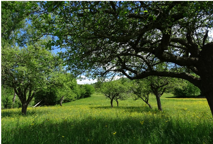
Figure 4. Ancien verger de pommiers à Saleich.