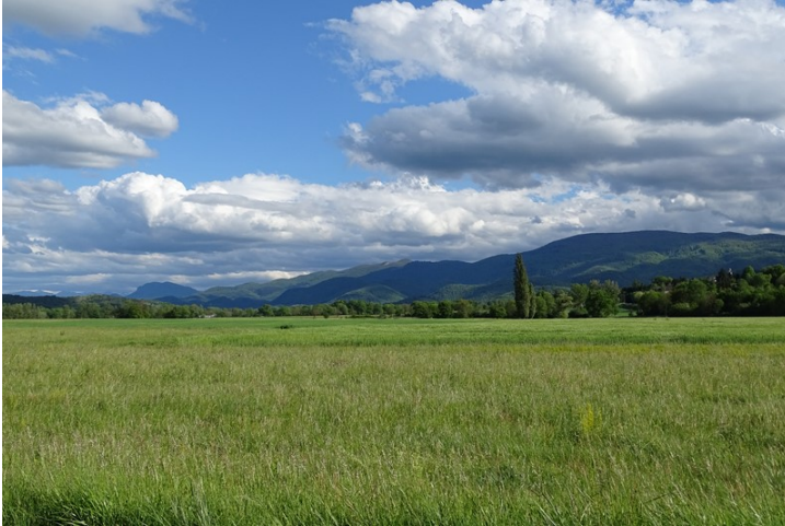
Figure 2. La basse vallée du Salat, entre plaine et coteaux. Prairies et cultures (au premier plan) sont relayées sur les marges par des coteaux très arborés. À l'arrière-plan, des sommets pyrénéens dominent le paysage.

La plaine alluviale, sur l'ancien lit majeur de la rivière du Salat (affluent de la Garonne), d'une largeur de deux à trois kilomètres, est en majorité occupée par des cultures céréalières et des prairies bénéficiant des alluvions qui recouvrent le fond de vallée. Ici des paysages mixtes, où les arbres se mélangent encore à certaines cultures, ont pu se maintenir ; mais ils restent le plus souvent cantonnés dans un rôle de haie brise-vent, d'arbres isolés, ou situés en limite de parcelles de moindre intérêt agronomique. Les coteaux, aux reliefs modestes avoisinant les 500 m d'altitude et qui encadrent cette plaine, sont principalement dédiés à l'élevage bovin, à la polyculture et aux prairies. L'arbre y est très présent, avec des haies, des bosquets, une forte composante forestière, mais aussi de nombreuses friches qui réduisent peu à peu les clairières et illustrent un phénomène de déprise agricole et de fermeture des milieux (figure 3). Ici ou là subsistent d'anciens vergers (figure 4) et parfois même des vestiges de hautains (figure 5). En dehors des forêts et des bosquets, les bocages, vergers et ripisylves forment encore le maillage du paysage, mais les pratiques traditionnelles sont peu maintenues et l'enfrichement est rapide par endroits (figure 6), comme dans d'autres secteurs en Haute-Garonne et Ariège.