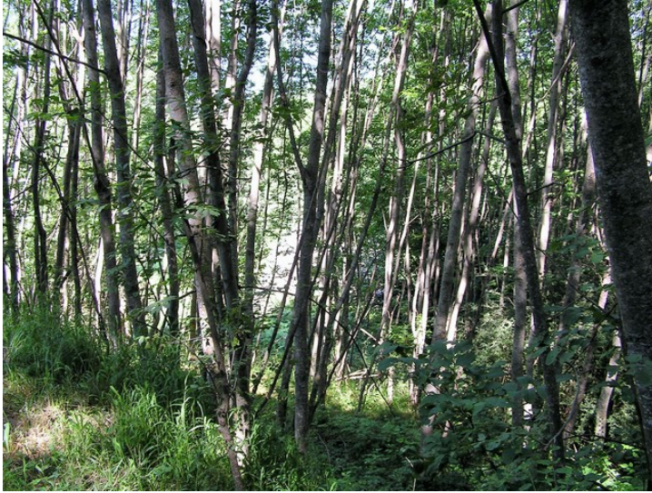
Figure 3. Accrus forestiers de frênes ayant envahi une ancienne prairie dans les coteaux au nord de la vallée.