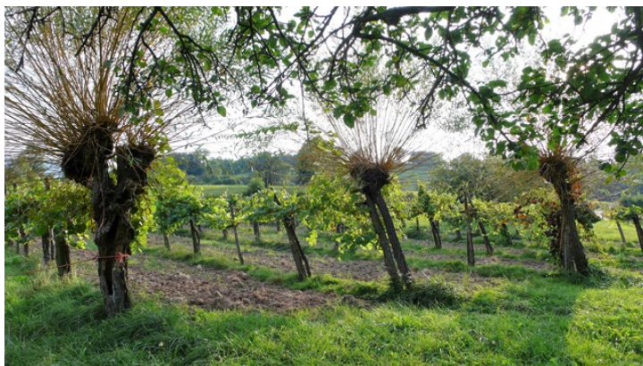
Figure 5. Hautain associant vignes et saules, avec du maraîchage entre les rangs, près de Prat-Bonrepaux.