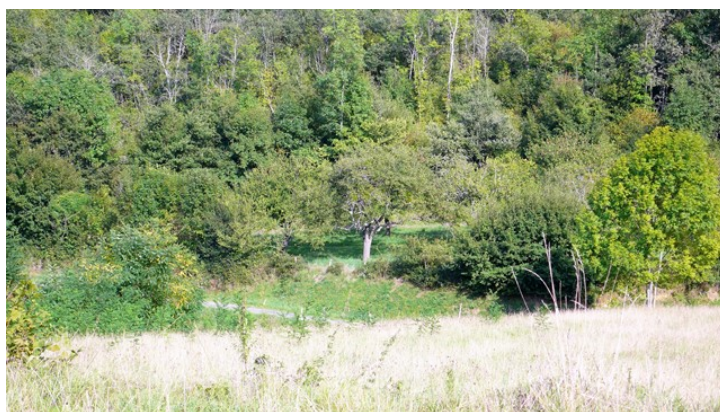
Figure 6. Fermeture progressive du paysage par embroussaillage.

Le maillage urbain est constitué des petites villes de Salies-du-Salat (près de 2 000 habitants) et Saint-Girons (6 550 habitants). Le reste du territoire est composé de petites communes (Mane, Prat-Bonrepaux, Lorp-Sentaraille...) qui forment des taches urbaines de faible envergure, ainsi que des hameaux et des petits villages parsemés. La multiplication de lotissements pavillonnaires autour des villages témoigne de l'arrivée de nouveaux habitants.