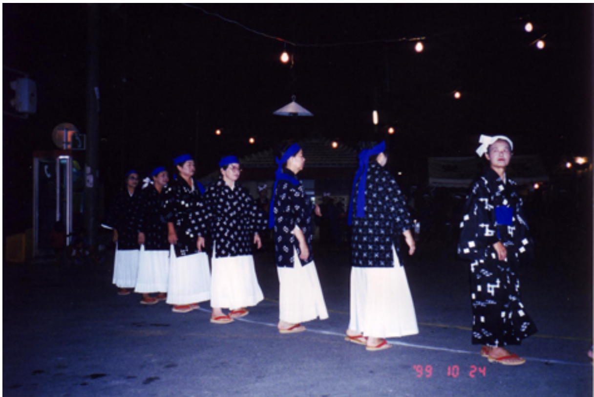
Festival usudeku , Okinawa, (Japon), 24 octobre 1999.

Puis j'ai aboli toute inertie, j'ai laissé aller les rythmes. Il y eut comme un surgissement primitif, une polyphonie sans forme, un déploiement continu sortant d'une obscurité silencieuse. Cela se mouvait dans l'illimité tout en se maintenant dans un abîme ombreux. On eût dit la mort, on eût dit la vie. » (Billetier, 2002, pp.124-125). Il est ici question de rencontre, avec la musique, avec son déploiement. Et c'est en faisant appel à l'expérience de son écoute que l'on peut le mieux comprendre ce passage.