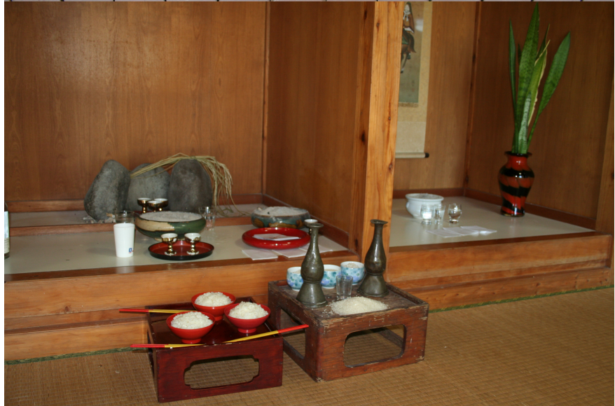
Cérémonie du riz, île de Kume, (Japon), 20 juillet 2006.

Offrandes d' awamori (littéralement « écume-forêt » –alcool de riz fermenté okinawaïen) et de riz pour les ancêtres devenus kamis , galets et karyasu (herbe propice au tissage) comme parcelles de génésis féconde ; et enfin, tablée d'alcool et de riz cuit pour les prêtresses qui s'appêtent à rentrer en action.