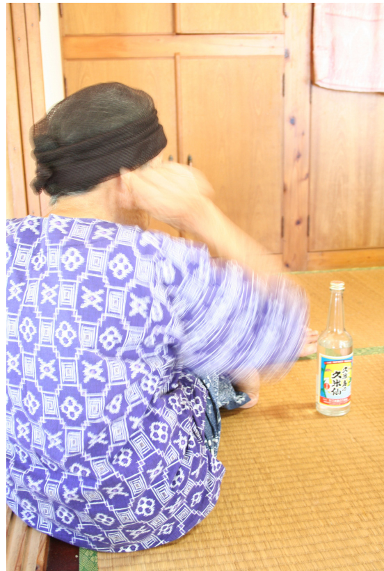
Cérémonie du riz, île de Kume, (Japon), 20 juillet 2006.

Les régimes d'activité successifs définissent la transe, laquelle permet d'entrer en contact avec le « monde autre » ( takai ), soit celui de l'invisible. Rituels certes codifiés, de l'ordre de la répétition, mais qui fournit par là même la métamorphose de celui qui agit et s'offre à être traversé par l'indicible, le non prévisible donc.