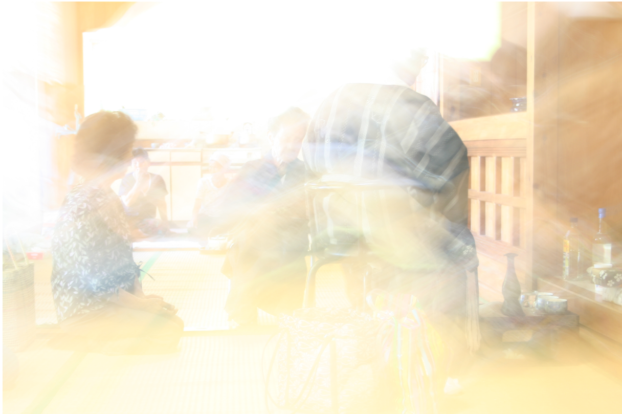
Cérémonie du riz, île de Kume, (Japon), 20 juillet 2006.

Participant à la progression lente de cette transe (comme semi hébétude), baignée par les effluves d'alcool dès dix heures du matin, mon état était pour le moins loin d'être « sobre ». Tandis, qu'ingurgitant à la suite de nombreux verres, leur état les conduisait à se balancer légèrement et à parler de manière de plus en plus inaudible, véritable tohu bohu confus et enivrant ; enchaînant les gestes du « passage » (des verres de mains en mains, du corps d'un lieu à un autre, de l'esprit d'un « monde » à un « autre »), jusqu'à ce qu'il ne soit dès lors plus possible d'en distinguer les frontières. Cette expérience permet ainsi de remettre en question la notion même de « descente » (comme prise de possession du corps par les esprits) ou de « montée » vers les esprits, soit la structuration même d'un tel « mouvement » différenciant le possédé du chamane, selon l'anthropologie japonaise actuelle.