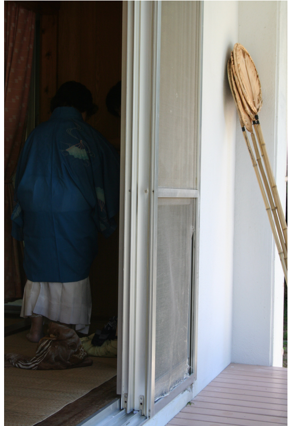
Cérémonie du riz, île de Kume, (Japon), 20 juillet 2006.

Les gestes dictent le passage d'états successifs,