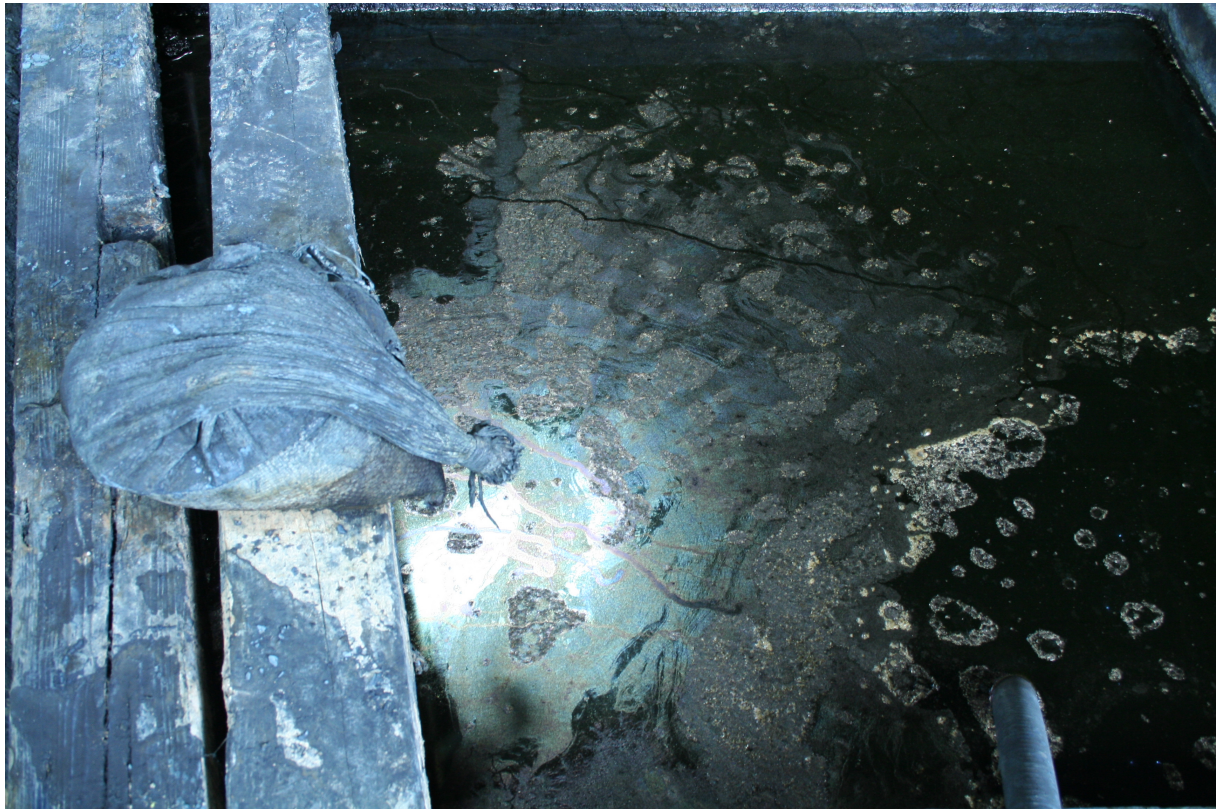
Cuve de décantation des feuilles de Ryūkyū ai, Nago, (Japon), 7 juillet 2003.