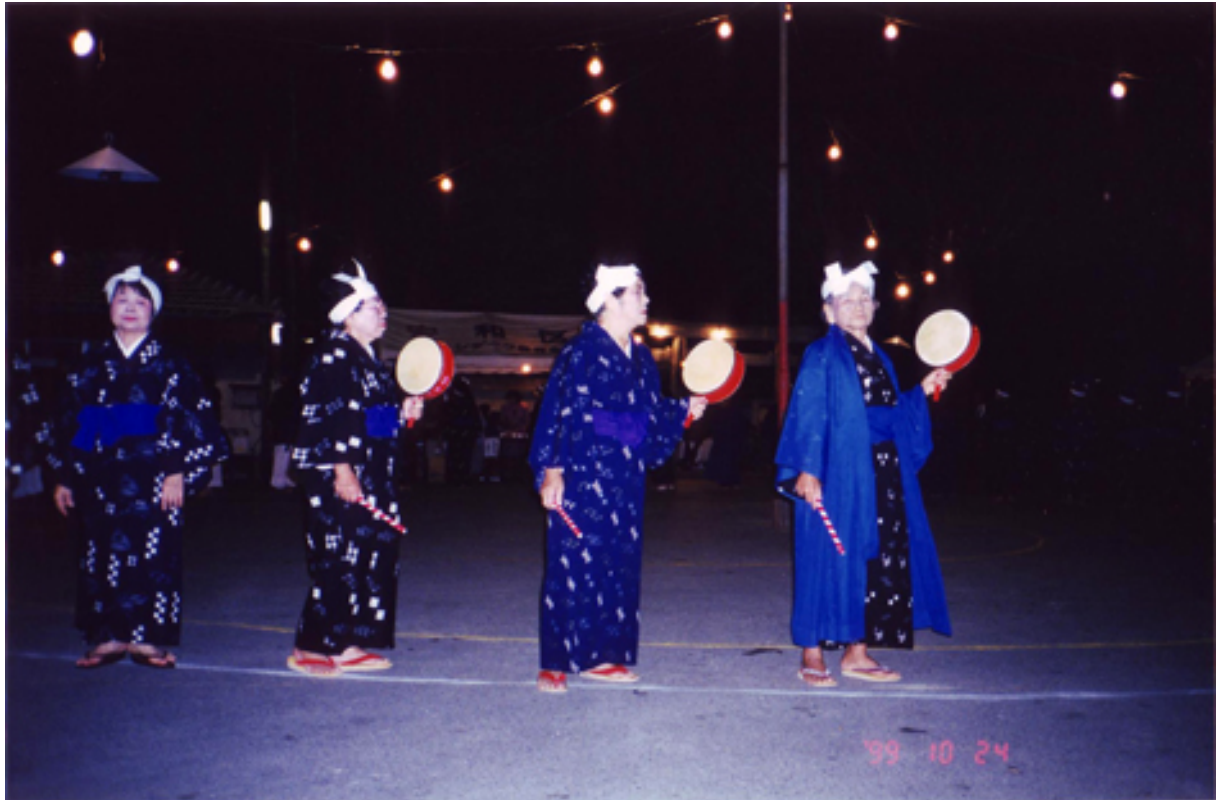
Festival usudeku , Okinawa, (Japon), 24 octobre 1999.

Si la ritualisation du chaos correspond à un passage obligé vers son oubli même