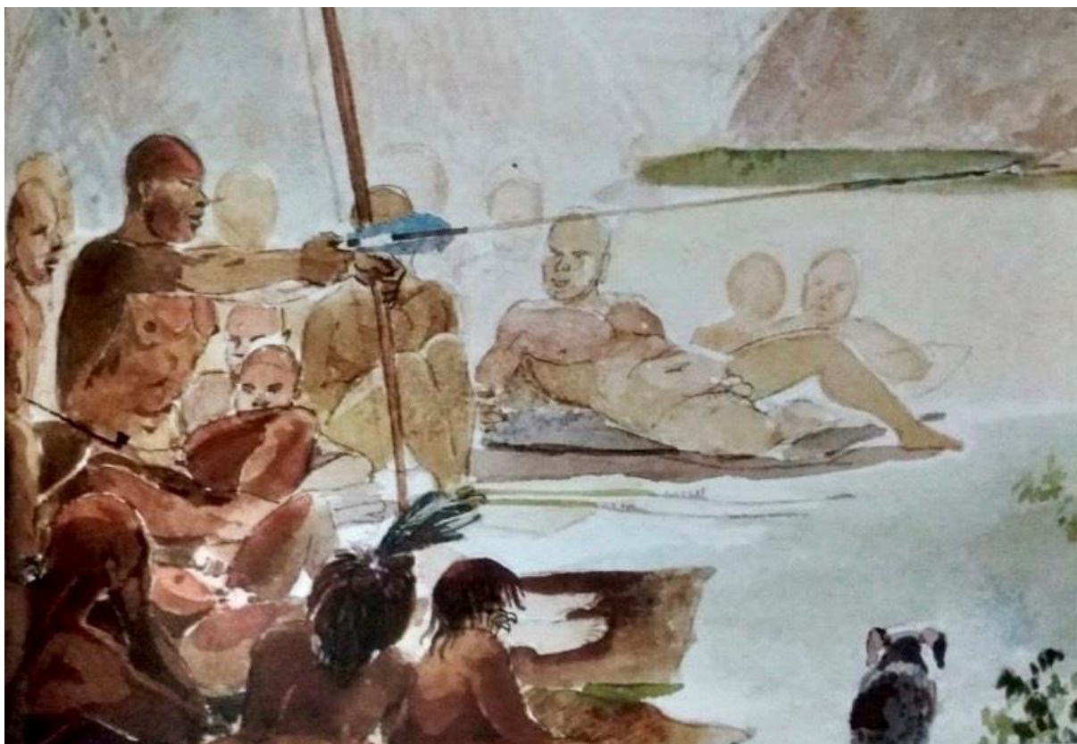
Figure n°6 – Jean-Baptiste Debret, Femme Camacan Mongoyo . Illustration extraite de l'ouvrage Voyage pittoresque et historique au Brésil de Jean Baptiste Debret , 1835.