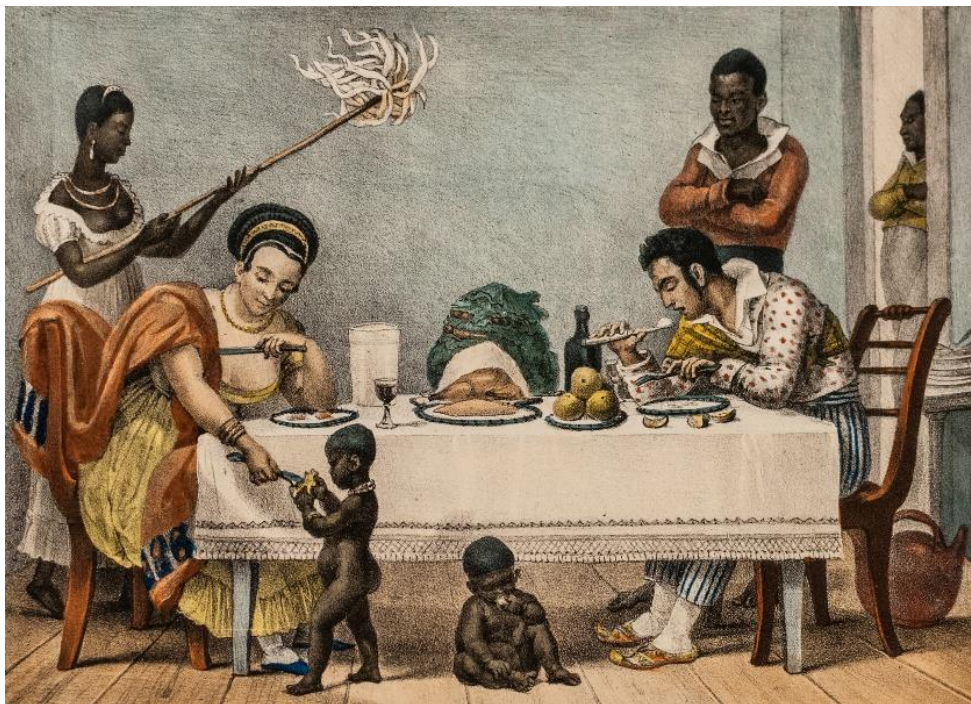
Illustration extraite de l'ouvrage Voyage pittoresque et historique au Brésil .

En raison de ses 15 années de travail et de recherche au Brésil, après son retour en France en 1831, Debret a publié à Paris, entre les années 1834 et 1839, trois volumes richement illustrés sous le titre Voyage Pittoresque et historique au Brésil . Avec une vaste documentation sur les types raciaux, les événements culturels, les coutumes et les traditions du Brésil, ce travail est présenté