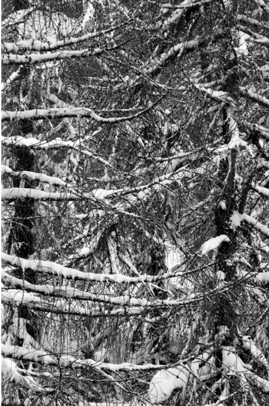
Abb. 2, Dezember , S. 99. © Gerhard Richter 2018 (04072018)