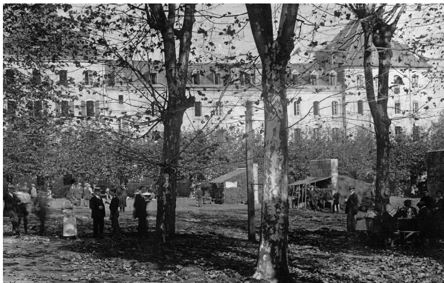
Ill. 1 : Le camp de Garaison.