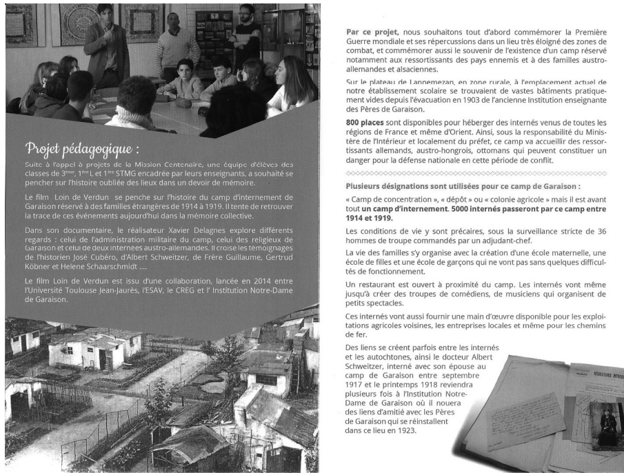
Ill. 4 : Jaquette du DVD Loin de Verdun.

en série R (« affaires militaires 1800-1940 »), sous-série 9 R (« prisonniers de guerre ennemis »), représente près de 8 mètres linéaires d'archives. Au regard de la courte période de fonctionnement du camp entre 1914 et 1919, il s'agit d'un ensemble considérable qui apporte des renseignements à la fois sur son organisation (rapports et correspondance du directeur, réglementation, discipline, comptabilité, gestion des fournitures, infrastructures mises en place, telles l'école ou l'infirmerie...) et sur les internés (états numériques par nationalités, listes nominatives, fichiers nominatifs, dossiers individuels, état des biens des internés, déplacements, transferts, mutations ou