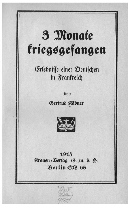
Ill. 2 : G. Köbner, journal (page de garde).