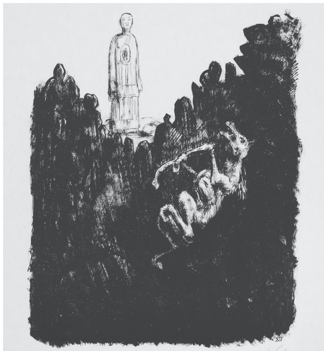
Fig. 4.