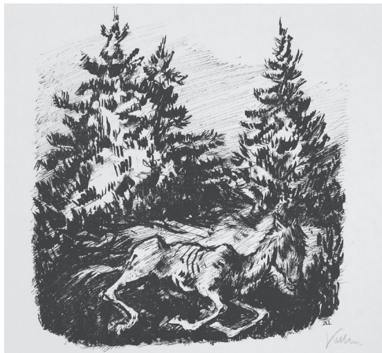
Fig. 3.