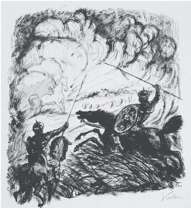
Fig. 2.