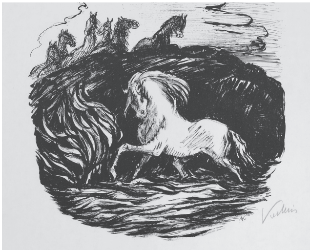
Fig. 1.