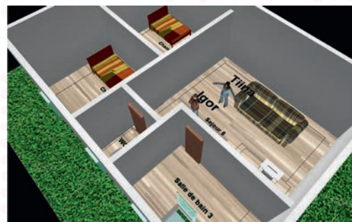
◀ Capture d'écran d'une simulation concernant la qualité de l'air intérieur réalisée avec GAMA.