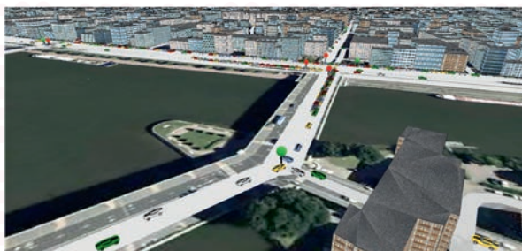
▲ Capture d'écran d'une simulation du trafic routier de la ville de Rouen réalisée avec GAMA.

Plus d'informations : http://gama-platform.org