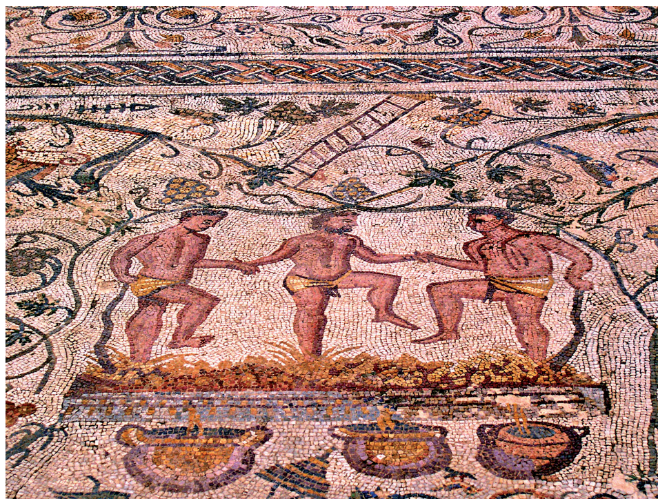
Fig. 8. Mosaïque de Mérida, Maison de l'Amphithéâtre. III e s. p.C..