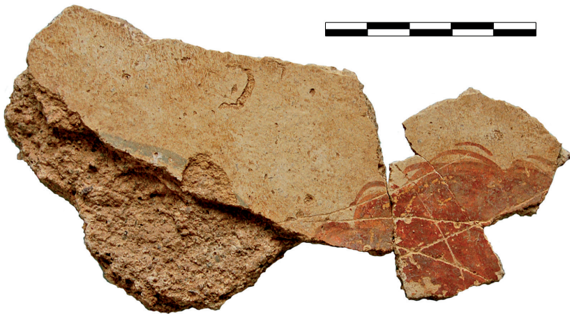
Fig. 2. Fragment d'enduit peint de la Gourjade. Chevelure.