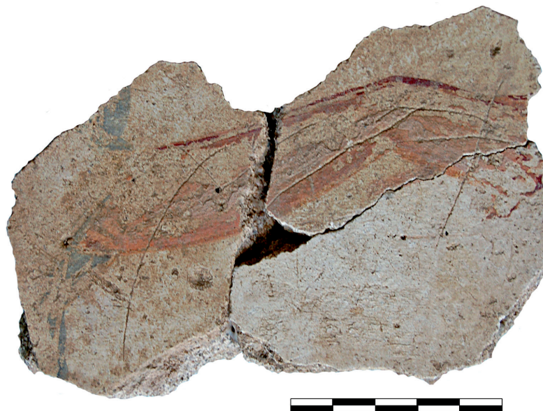
Fig. 4. Fragment d'enduit peint de la Gourjade. Bras émergeant d'une tunique.

la partie inférieure d'un corps masculin, les parties génitales apparentes et les jambes nues. La chair est traitée dans un camaïeu d'ocre rouge, de subtiles taches de blanc apportant de la lumière et du volume à ce fragment d'anatomie. Les jambes sont manifestement en mouvement, saisies dans une séquence de piétinements. Elles s'agitent dans une bassine circulaire traitée dans les mêmes tons ocre rouge.