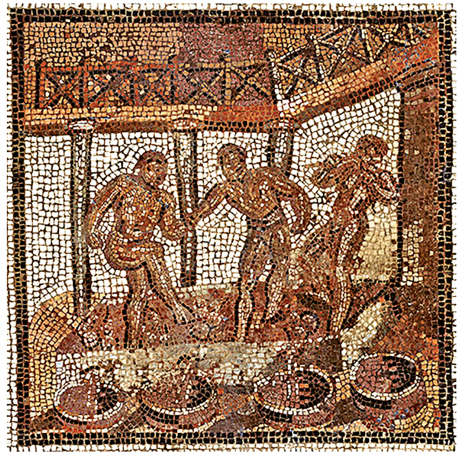
Fig. 6. Mosaïque de Saint-Romain-en-Gal conservée au Musée des Antiquités Nationales de Saint-Germain-en-Laye. Scène de foulage du raisin. III e s. p.C..