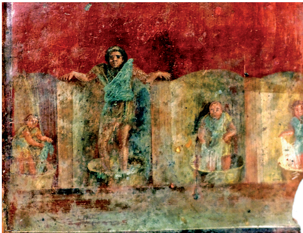
Fig. 9. Décor du pilier de la fullonica de L. Veranius Hypsaesus. Scène de foulage des tissus. Vers 70 p.C..

le plus complet et le plus précieux 19 . Mis au jour dans la “ Fullonica de L. Veranius Hypsaesus” (VI 8, 2.20-21), un pilier jadis érigé près du large bassin maçonné dans l’ atrium ( lacus qui servait au rinçage des tissus) est aujourd’hui conservé au Musée archéologique national de Naples 20 . Il présente, disposées en registres, plusieurs scènes figurées décrivant différentes étapes de l’ ars fullonica 21 . Celle qui nous retiendra plus particulièrement ici concerne justement les activités de foulage des tissus (fig. 9).