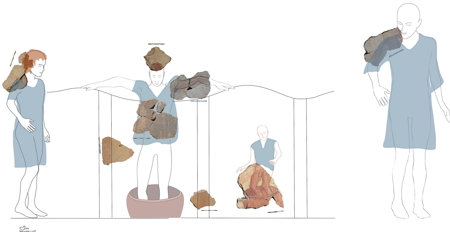
Fig. 15. Proposition de mise en situation des quatre foulons de la Gourjade (restitution : A. Dardenay ; infographie : M.-L. Maraval/Sygne).

L'un des deux personnages complémentaires du décor de la Gourjade (fig. 13) est représenté à la même échelle (environ 50 cm de hauteur) que le "foulon n°2" (celui aux coudes pliés). Le fragment qui atteste son existence représente la partie arrière de son crâne et son épaule droite. Il porte la même tunique bleue que son compagnon et se dressait de trois-quarts vers la droite. Quant au dernier fragment clé, il révèle l'existence d'un personnage représenté à une échelle supérieure aux trois autres, puisqu'il devait mesurer environ 65 cm de haut (fig. 14). Comme pour le précédent, rien ne permet d'affirmer qu'il appartenait exactement à la même scène, même s'il provient du même ensemble pictural et présente le même vêtement. On distingue, sur les fragments subsistants de ce personnage, la représentation de son bras droit couvert d'une manche bleue et la partie inférieure de sa joue droite et de son menton légèrement baissé en direction de ce même bras. On remarque, donc, que ces deux derniers personnages appartiennent sans doute au même groupe d'artisans, vêtus d'une tunique bleue qui les caractérise, mais peut-être pas au même groupe social (hommes libres, affranchis ou esclaves), ce qui expliquerait l'utilisation de la perspective hiérarchique pour les représenter, à moins qu'ils n'accomplissent des tâches différentes dont la hiérarchie serait ainsi marquée. Ces différences de proportions peuvent, autrement, témoigner