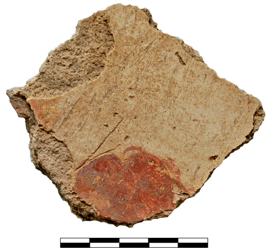
Fig. 3. Fragment d'enduit peint de la Gourjade. Chevelure.

terre de ces enduits ne leur a donc pas causé de dommages irrémédiables, permettant une analyse iconographique de la couche picturale.