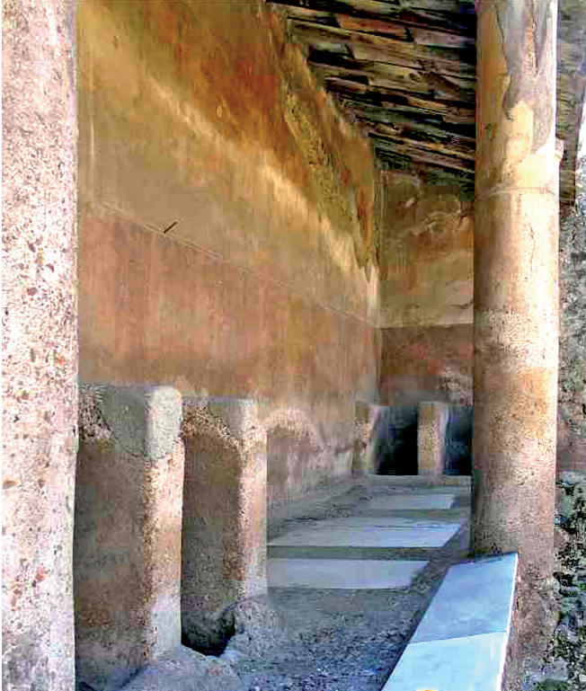
Fig. 10. Stalles de la fullonica di Orfeo, Pompéi.

recouverte d'un vêtement bleu relevé et noué au-dessus de son épaule gauche, découvrant ainsi totalement la partie inférieure de son corps jusqu'au-dessus de ses parties génitales qui apparaissent clairement. Ses jambes tannées effectuent le mouvement cadencé typique des scènes de foulage, la jambe gauche en appui et la jambe droite légèrement relevée. Dans les stalles situées de part et d'autre de ce foulon se trouvent trois autres ouvriers, représentés à une échelle correspondant à la moitié de la hauteur du premier. La minimalisation de leur échelle doit-elle être mise en relation avec une importance moindre de leur activité dans la hiérarchie des tâches de l'atelier ? On observe, en effet, que le personnage de gauche et les deux de droite ne foulent pas le tissu mais semblent le rincer, ou peut-être l'essorer. Ils sont ainsi tous trois figurés accomplissant des gestes similaires, extrayant de la bassine dans laquelle ils prennent pied le tissu qui y était plongé. On est toutefois en droit de se demander pourquoi ces trois ouvriers se dressent dans une bassine si ce n'est pour fouler. Quoi qu'il en soit, aussi bien leurs dimensions que la tâche qu'ils sont en train d'accomplir les différencient du foulon de la seconde stalle. Dans le cas où il s'agirait bien de quatre foulons, la différence d'échelle pourrait être simplement destinée à évoquer une hiérarchie des statuts au sein de l'atelier, entre un homme libre (ou un affranchi) et trois esclaves, par exemple 23 .