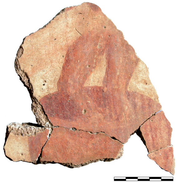
Fig. 1. Fragment d'enduit peint de la Gourjade. Partie inférieure du corps d'un foulon (cl. CERAC).

Il s'agit d'un petit ensemble dont seuls quelques fragments ont pu faire l'objet de remontages partiels. Quelques vestiges attestent toutefois la présence d'une scène figurée dont un détail au moins a retenu l'attention des archéologues du CERAC depuis la découverte de cet ensemble pictural, puisqu'il figure la partie inférieure du corps d'un homme nu, les jambes s'agitant dans un bassin circulaire. En raison du caractère très sporadique des vestiges de ce décor, il n'a pas été proposé jusqu'ici de restituer le détail de cette figure que l'on interprétait comme étant celle d'un vendangeur (fig. 1). Toutefois, une réévaluation et une étude précise des fragments du décor dans son ensemble révèlent que les "fragments clés" sont assez nombreux pour proposer une restitution globale du décor mis au jour. Depuis leur découverte, ces fragments d'enduits peints ont été conservés avec méthode, leur assurant ainsi un état de conservation tout à fait satisfaisant. Le mortier sur lequel la peinture a été appliquée était solide et de bonne facture et ne présente donc pas de dégradations. La composition du mortier offre, d'autre part, le caractère homogène, attestant la cohérence des fragments qui appartenaient vraisemblablement à un même décor. La couche picturale reste tout à fait lisible, en dépit de traces d'usure – de frottements en particulier – datant de l'Antiquité et résultant des altérations subies alors que ce décor était en place. Le séjour sous