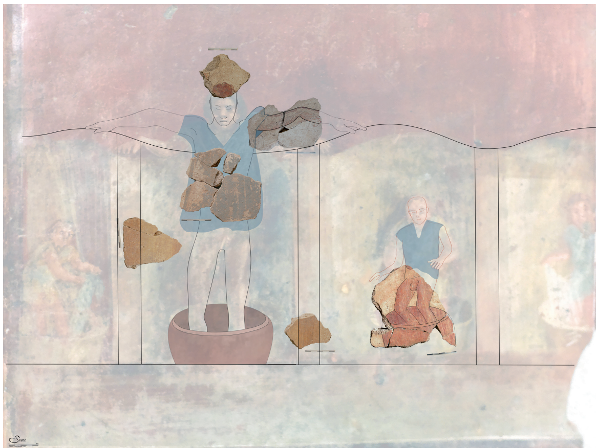
Fig. 12. La scène de foulage de la Gourjade est superposée à celle de Pompéi (en filigrane) afin de montrer les correspondances d'échelle (restitution : A. Dardenay ; infographie : M.-L. Maraval/Sygne).