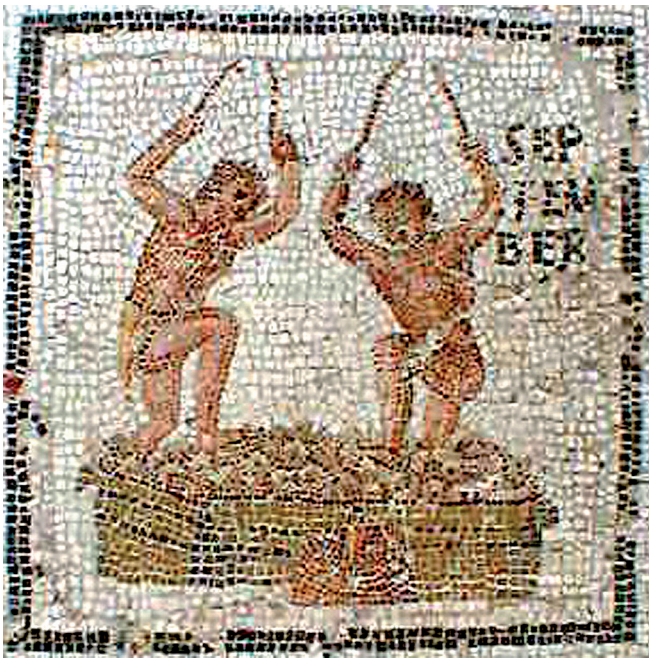
Fig. 5. Mosaïque de Thydrus. El Jem (Tunisie). Représentation du mois de septembre. Foulage du raisin. Vers 230 p.C..