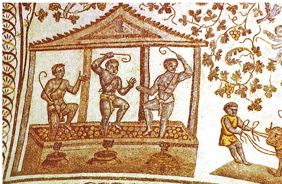
Fig. 7. Mosaïque de la voûte du mausolée de Constantina, fille de Constantin. Rome, Santa Costanza. Vers 354 p.C. (Tchernia & Brun 1999, fig. 76).