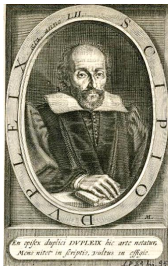
Scipion Dupleix (1569-1661)

Tolosa non è la sua prima meta. La testimonianza dell'umanista Scipion Dupleix, che viveva nella piccola città guascone di Condom, ci assicura circa il passaggio di un «Italiano di nome Lucilio Vanini, il quale vi soggiorna per circa due mesi come medico empirico». Dupleix aggiunge: «Nessun avviso