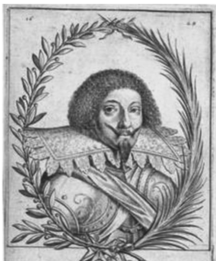
Le maréchal de Bassompierre (1579-1646)

Negli anni 1615-1616 Vanini è a Parigi, ove frequenta la corte di Maria de' Medici, dominata Italiani e particolarmente dal fiorentino Concino Concini. Qui vive sotto la protezione di un magnate, François de Bassompierre, il quale lo nomina cappellano del reggimento delle truppe svizzere che formano la guardia del corpo del Re Luigi XIII. Vanini gli dedica il De admirandis naturae reginae deaeque mortalium arcanis , il suo ultimo libro. All'inizio del suo soggiorno in Francia nella capitale francese regna uno straordinario clima di libertà. L'empietà e il libertinismo sono alla moda. La comparsa del De admirandis è il momento culminante di questo periodo. La sua condanna da parte della Sorbona segna un brusco capovolgimento: nella corte, nella società e nell'Università i devoti riprendono l'offensiva. Le protezioni di Vanini crollano per effetto delle violente reazioni dell'anti-italianismo che cresce a Parigi e produce l'assassinio del Concini. Alla fine del 1616, o agli inizi del 1617, Vanini è costretto a lasciare la capitale. Questa è la prima ragione del suo arrivo a Tolosa nel Sud-Ovest del regno.