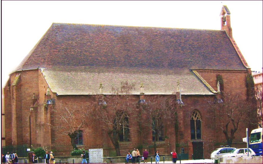
La chiesa dei Récollets dove Vanini ha probabilmente atteso il proprio supplizio (foto D. F.).