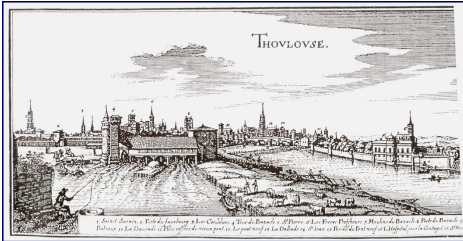
Vista di Tolosa nel 1642 (mappa di Collignon, Musée Paul Dupuy - Toulouse)

rafforzata. La Chiesa controlla le principali istituzioni civili: la municipalità dei Capitouls e la grande Corte di giustizia del Parlamento.