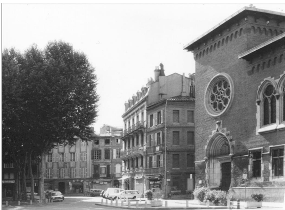
La Place du Salin oggi, luogo del supplizio

Fin dal Medioevo ai bestemmiatori sono frequentemente inflitti castighi corporali: le labbra recise o la lingua tagliata puniscono il colpevole in ciò che ha recato offesa a Dio. Qualche monumento dell'epoca, come il timpano della chiesa abbaziale di Conques – nella provincia di Rouergue, vicino Tolosa – rappresenta la mutilazione della lingua. Vanini è stato legato con una catena a un palo. Barthélemy de Gramond, che ha assistito allo spettacolo, racconta come si è svolto il supplizio: «Gli si ordinò di presentare la lingua perché fosse tagliata. Egli si rifiutò. Il boia non poté averla che con le tenaglie, delle quali si servì per strappargliela e per reciderla. Non si mai sentito un grido più spaventoso. Lo avreste scambiato per il muggito di un bue». 17