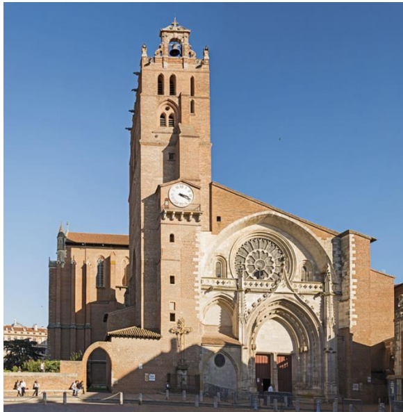
La cattedrale di Saint-Etienne

Tutti i testimoni riconoscono la coraggiosa arroganza di questo giovane uomo nei suoi ultimi istanti di vita. Gli Annali di Tolosa , redatti poco dopo, lo dicono chiaramente: «Egli si dava l'aria di morire con la grande costanza di un filosofo e nelle vesti di un uomo che non si attendeva nulla dopo la morte, poiché non credeva affatto nella immortalità dell'anima. Il buon padre che lo assisteva pensò di scuoterlo, mostrandogli il crocifisso e ricordandogli i sacri misteri dell'incarnazione e della passione di Nostro Signore. Ma questa tigre rabbiosa, accecata e ostinata nelle sue false dottrine, sprezzava ogni cosa e non volle mai posarvi lo sguardo. E si apprestava a questa morte come alla sua ultima fine». 15