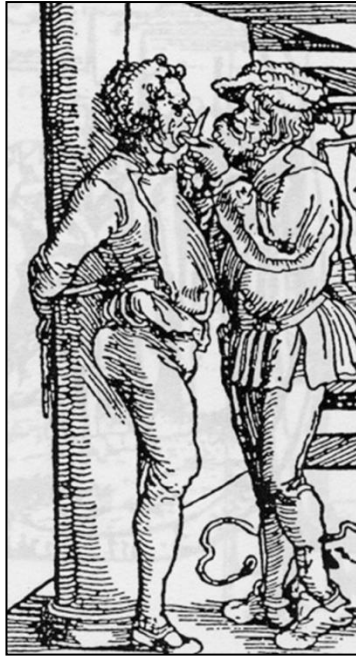
Fig. 19. Il supplizio dei bestemmiatori: la mutilazione della lingua (timpano della chiesa abbaziale di Conques (XII secolo) Stampa tedesca (XVI secolo).

dare esecuzione a tale giusta sentenza e quando gli si volle imporre di chiedere il perdono a Dio, al re e alla giustizia, egli rispose di non sapere che cosa fosse Dio e che di conseguenza non avrebbe mai domandato perdono ad una entità immaginaria. I ministri della giustizia, nondimeno, insisterono affinché lo facesse, sicché alla fine egli imbastì questo discorso: Ebbene domando perdono a Dio se ce n'è uno . E quando fu costretto a chiedere perdono al re, disse che lo chiedeva perché così si voleva, ma che credeva di non essere colpevole verso sua Maestà e di averla sempre onorata come meglio gli era stato possibile. Quanto ai signori della giustizia, li mandava a trentamila carrettate di diavoli. 16 Il giro della città si conclude in Place du Salin, in prossimità del Parlamento. Il carnefice lo attende per infliggergli i supplizi stabiliti dalla sentenza; in primo luogo la mutilazione della lingua.