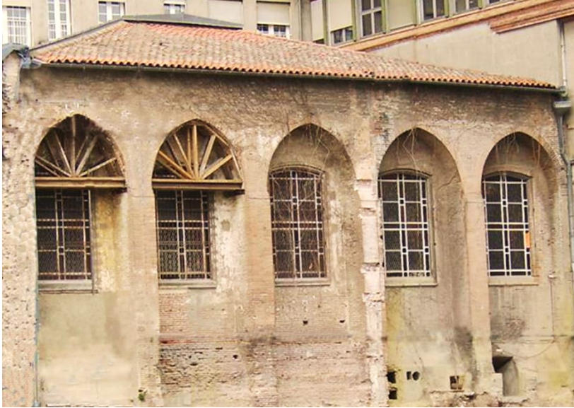
Uno dei rari resti del Parlamento di Tolosa : la Grand Chambre dove fu giudicato Vanini