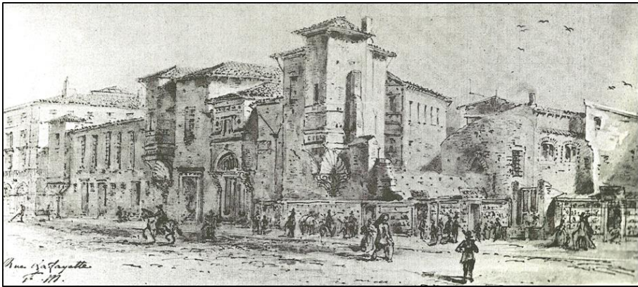
Gli antichi edifici del Capitole , sede della municipalità tolosana (Musée Paul Dupuy - Toulouse)

Infatti, per questi notabili, castigare uno straniero per dare un esempio a tutti i libertini tolosani, sembra la soluzione ideale. Ideale per ricondurre alla ragione una gioventù smarrita... E soprattutto per interrogarsi sulle cause profonde che l'avevano condotta a respingere la cappa pesante dell'ordinamento religioso imposto dalla Chiesa alla città della Linguadoca.