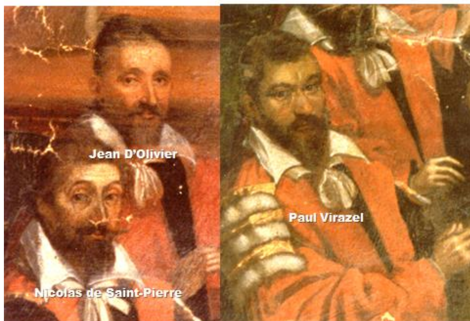
Fig. 10. I Capitouls responsabili dell'arresto di Vanini. Dipinto di Jean de Chalette. Archives municipales de Toulouse.

Ogni anno, i notabili tolosani designano al loro interno otto Capitouls che formano la municipalità della città. Sono essi che, ricevuta la denuncia relativa alle affermazioni blasfeme di un misterioso medico italiano, decidono di arrestare Vanini.