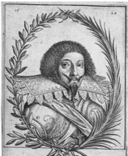
Le maréchal de Bassompierre (1579-1646)

Negli anni 1615-1616 Vanini è a Parigi, ove frequenta la corte di Maria de' Medici, dominata Italiani e particolarmente dal fiorentino Concino Concini. Qui vive sotto la protezione di un magnate, François de Bassompierre, il quale lo nomina cappellano del reggimento delle truppe svizzere che formano la guardia del corpo del Re Luigi XIII. Vanini gli dedica il De admirandis naturae reginae deaeque mortalium arcanis , il suo ultimo libro. All'inizio del suo soggiorno in Francia nella capitale francese regna uno straordinario clima di libertà. L'empietà e il libertinismo sono alla moda. La comparsa del De admirandis è il momento culminante di questo periodo. La sua condanna da parte della Sorbona segna un brusco capovolgimento: nella corte, nella società e nell'Università i devoti riprendono l'offensiva. Le protezioni di Vanini crollano per effetto delle violente reazioni dell'anti-italianismo che cresce a Parigi e produce l'assassinio del Concini. Alla fine del 1616, o agli inizi del 1617, Vanini è costretto a lasciare la capitale. Questa è la prima ragione del suo arrivo a Tolosa nel Sud-Ovest del regno.