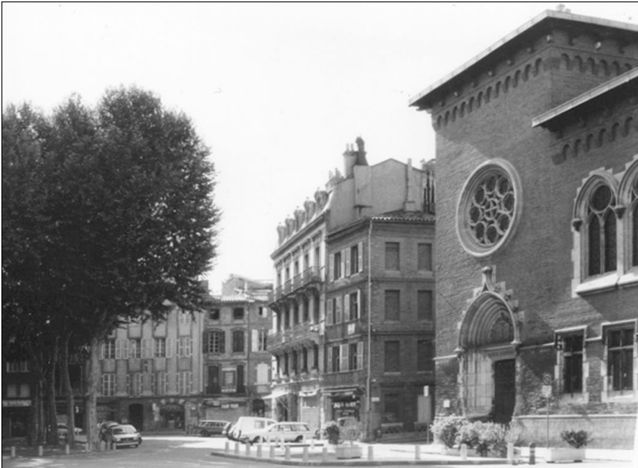
La Place du Salin oggi, luogo del supplizio

Fin dal Medioevo ai bestemmiatori sono frequentemente inflitti castighi corporali: le labbra recise o la lingua tagliata puniscono il colpevole in ciò che ha recato offesa a Dio. Qualche monumento dell'epoca, come il timpano della chiesa abbaziale di Conques – nella provincia di Rouergue, vicino Tolosa – rappresenta la mutilazione della lingua. Vanini è stato legato con una catena a un palo. Barthélemy de Gramond, che ha assistito allo spettacolo, racconta come si è svolto il supplizio: «Gli si ordinò di presentare la lingua perché fosse tagliata. Egli si rifiutò. Il boia non poté averla che con le tenaglie, delle quali si servì per strappargliela e per reciderla. Non si mai sentito un grido più spaventoso. Lo avreste scambiato per il muggito di un bue». 17