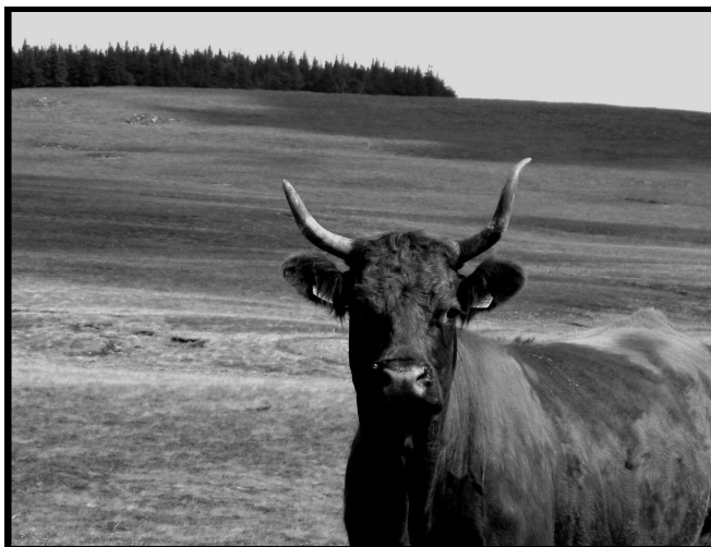
Figure 8.5 Salers sur le Cézallier

la talent dans l'indiscrétion impudique, l'exigence littéraire au détriment du tact élémentaire et l'amour vache d'un auteur pour ses personnages. 4