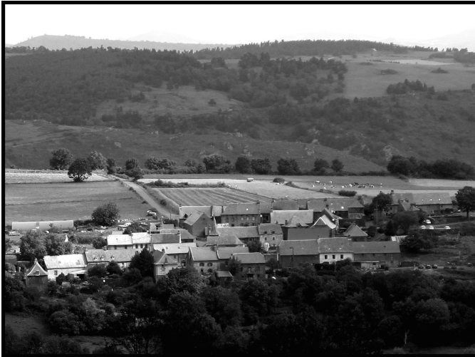
Figure 8.1. Lussaud, août 2014 (crédit : Jérôme Cabot)

funèbre, vers laquelle tous convergent : elle est l'occasion d'une série de portraits et, au-delà, d'anecdotes et de considérations sur la vie paysanne, sa rudesse et sa beauté. Contre le folklore idéalisant et les conventions de la littérature de terroir, la prose de Jourde développe un éloge paradoxal, dégageant l'héroïsme humble de cette paysannerie en voie d'extinction, puisant dans la mémoire orale les ingrédients d'une épopée.