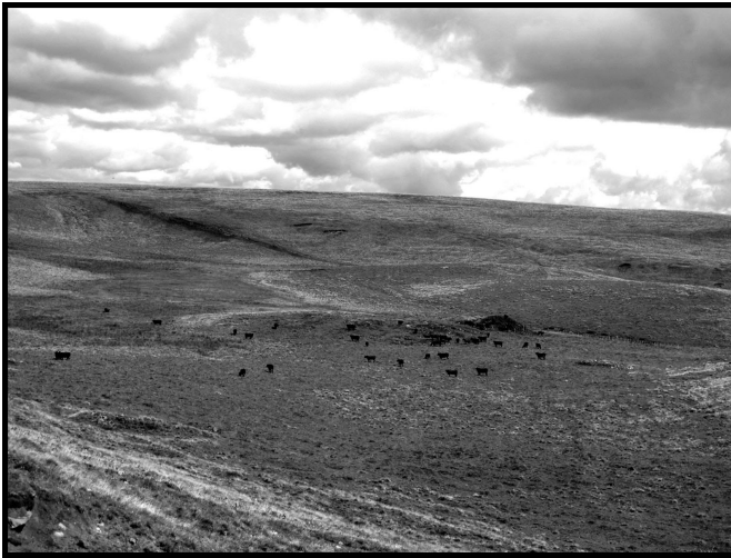
Figure 8.2 Le Cézallier

caractérisée par une forte densité de population. Cette analogie avec l'archétype de l'espace plat, désertique, continental et inexploré, est récurrente dans le texte : le patois rappelle les langues altaïques ; les habitants, mal vus des villages voisins ou du curé, sont comparés aux brigands d'une zone tribale pashtoune ; telle figure locale est "une beauté tadjike ou kurde" (2003, 57), évoque un Sarrasin, un Tangoute, un Ouïgour, un Mongol d'Oulan-Bator, un sumotori ou un nomade kirghize. La rupture du consensus homotopique est accentuée par une multiplication de références géographiques contradictoires : villages tibétains, bourreaux chinois, pueblos indiens et dieux zapotèques, paysages de western. Il y a là l'expression d'un fort potentiel romanesque, d'un exotisme syncrétique des confins, de la Frontière et de la terra incognita . Dans La première pierre , on trouve une formule condensant efficacement ces références géographiquement contradictoires et symboliquement homogènes : Lussaud est "un compromis entre l'Asie centrale et le Far West : le Far Centre" (2013, 162).