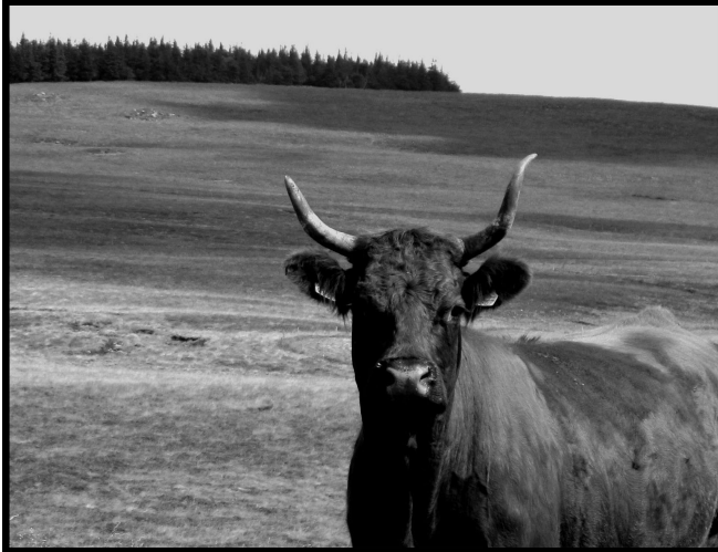
Figure 8.5 Salers sur le Cézallier

la talent dans l'indiscrétion impudique, l'exigence littéraire au détriment du tact élémentaire et l'amour vache d'un auteur pour ses personnages. 4