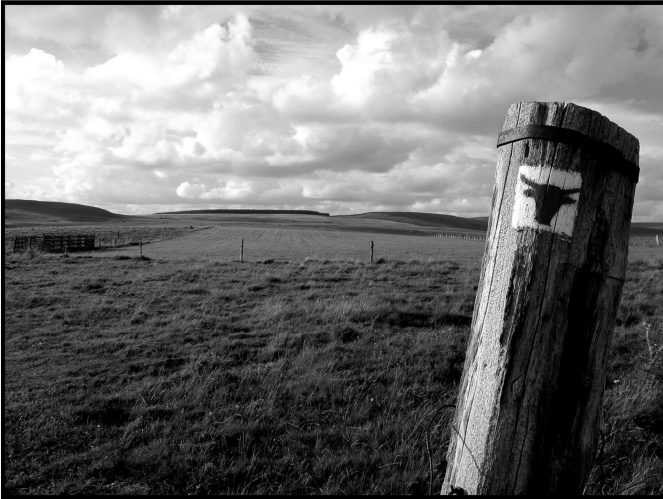
Figure 8.4 Pâtures du Cézallier (crédit : Jérôme Cabot)