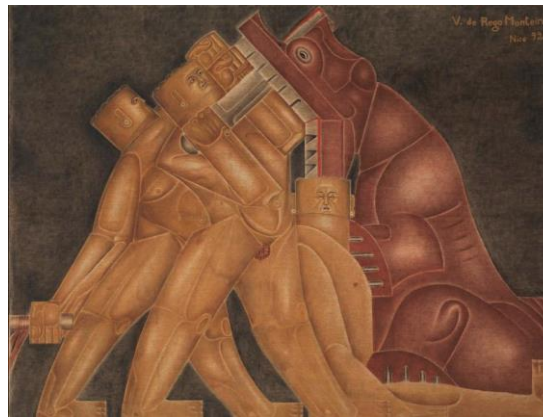
Vicente do Rego Monteiro A caçada, 1923 Óleo sobre tela 202cm x 259,2cm Museu de Arte Moderna de Paris, França

Vicente do Rego Monteiro, desde o início de sua carreira como pintor, materializou através de suas imagens mitos e cenas de um Brasil exótico que seduzia os olhos europeus. Ele transitou entre as figurações geometrizadas derivadas do cubismo e o universo indígena brasileiro marcados por uma forte influência da obra e dos conselhos de Fernand Léger.