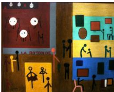
Joaquim do Rego Monteiro La Rotonde, 1927 Óleo sobre tela 81cm x 100cm Museu de Arte Moderna Aloisio Magalhaes, Recife - PE

A incógnita sobre a obra de Joaquim do Rego Monteiro é grave. Sua obliteração tem razões: internacionalismo, distância e escassez. [...] Por que a crítica modernista não se interessou por sua pintura? Não só pela distância, mas também por não se dedicar a temas nacionalistas, objetivo maior de alguns deles? A escassez e o desconhecimento do paradeiro da obra desse Rego Monteiro dificultam a avaliação de seu significado e da extensão mesma da contribuição pernambucana para o Modernismo brasileiro. [...] Joaquim do Rego Monteiro foi o primeiro brasileiro a fazer experimentos geométricos a partir da lógica interna de sua obra plástica, e não do simples recurso a uma voga. Suas telas abstratas seriam um certo grau zero do projeto construtivo brasileiro. (HERKENHOFF, 2006, p. 45-46)