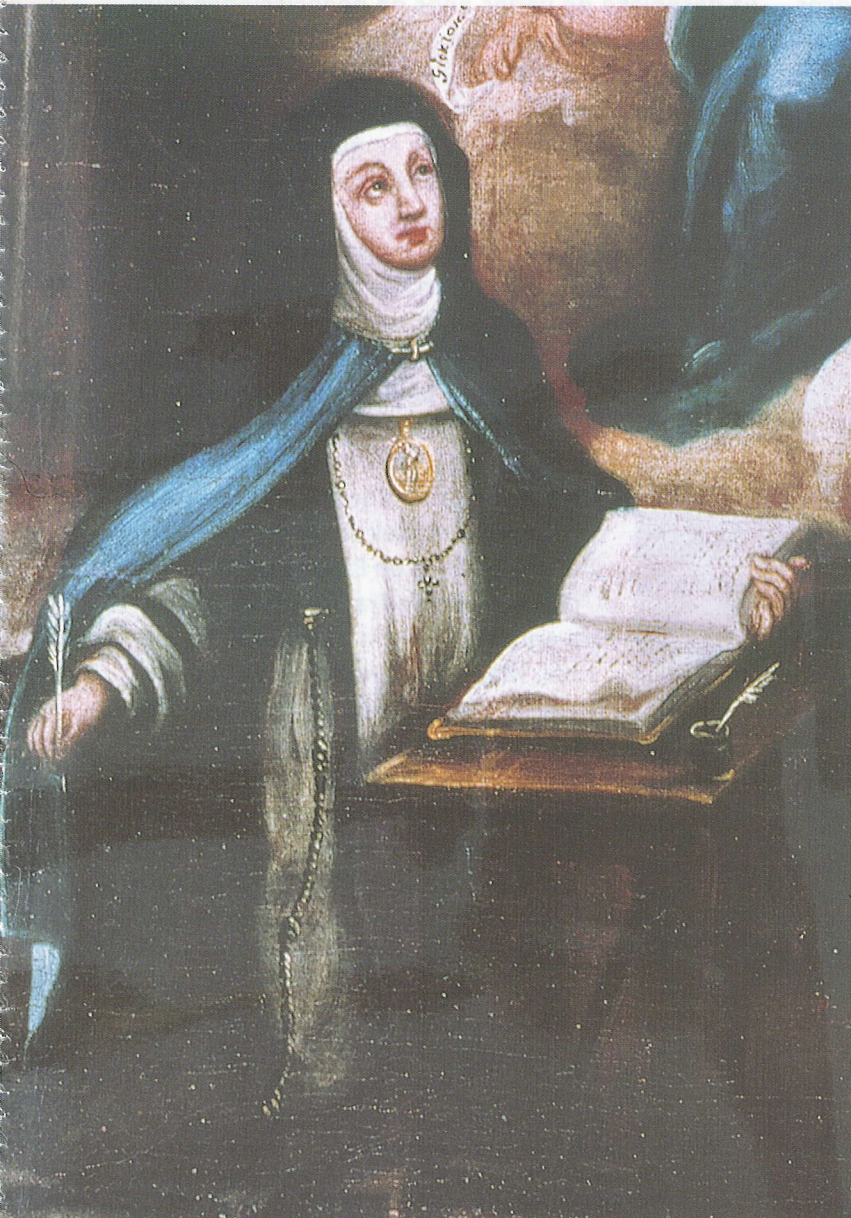
Sor María de Jesús de Ágreda como escritora inspirada por la Virgen. Murcia, Monasterio de Religiosas Justinianas de Madre de Dios

Este epistolario constituye un testimonio histórico y espiritual totalmente in-