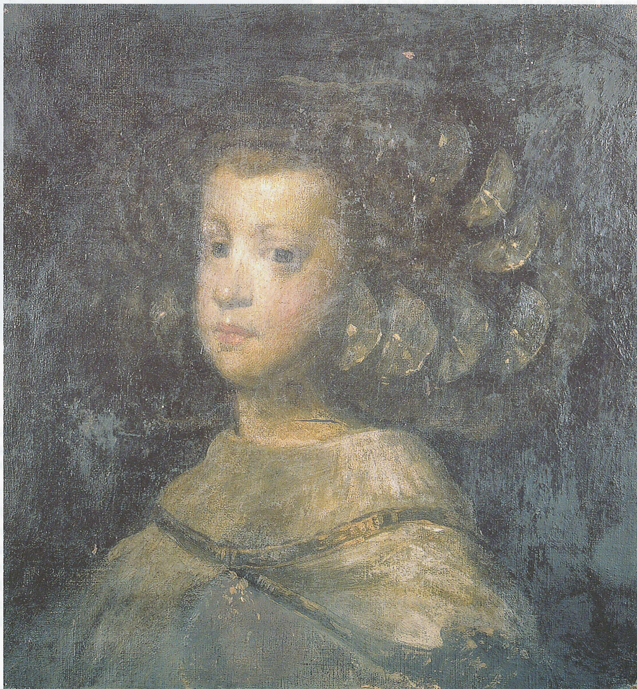
Retrato de la infanta María Teresa. Taller de Velázquez, hacia 1652 (óleo sobre lienzo, Museo del Convento de la Inmaculada Concepción, Ágreda, 52x48 cm)

amemos unos a otros, y que para el prójimo queramos lo que para nosotros mismos; y si esto se cumpliera, jamás hubiera discordias ni guerras» (3) . Y, paralelamente a su labor espiritual, puede considerarse que es también mérito de la religiosa haber logrado una forma de paz, imperfecta y frágil, pero real, entre Francia y España. «Muchos años ha que he dese-