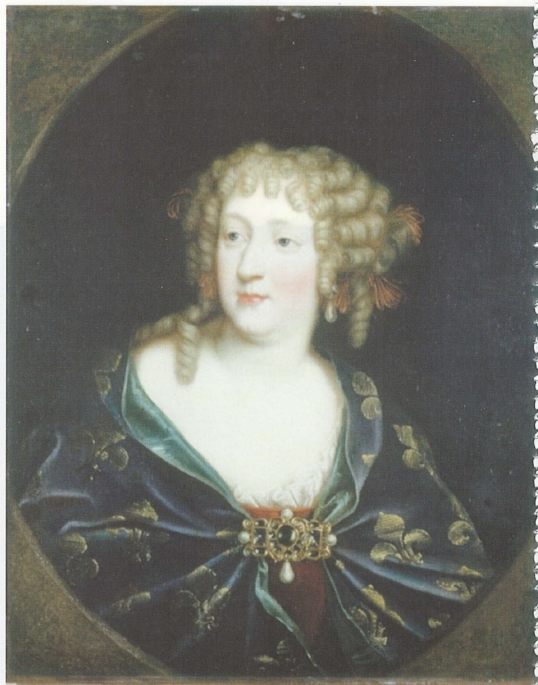
Anónimo, María Teresa, ca. 1660-1683 (óleo sobre lienzo, Museo Carnavalet, París)

Para poder apreciar lo que cada una de las corresponsales pretende, conviene comprender el tipo de relación que tienen la monja y la Reina. En una carta al Rey del 22 de junio de 1660, por lo tanto escrita cuando el Rey ya ha regresado de la boda de su hija celebrada en Fuenterrabía, por poderes, el 3 de junio y en San Juan de Luz el 9, María de Ágreda escribe: «Deseo saber si V.M. ha llegado con salud a su casa y a la compañía de tan preciosas prendas (8) , y si