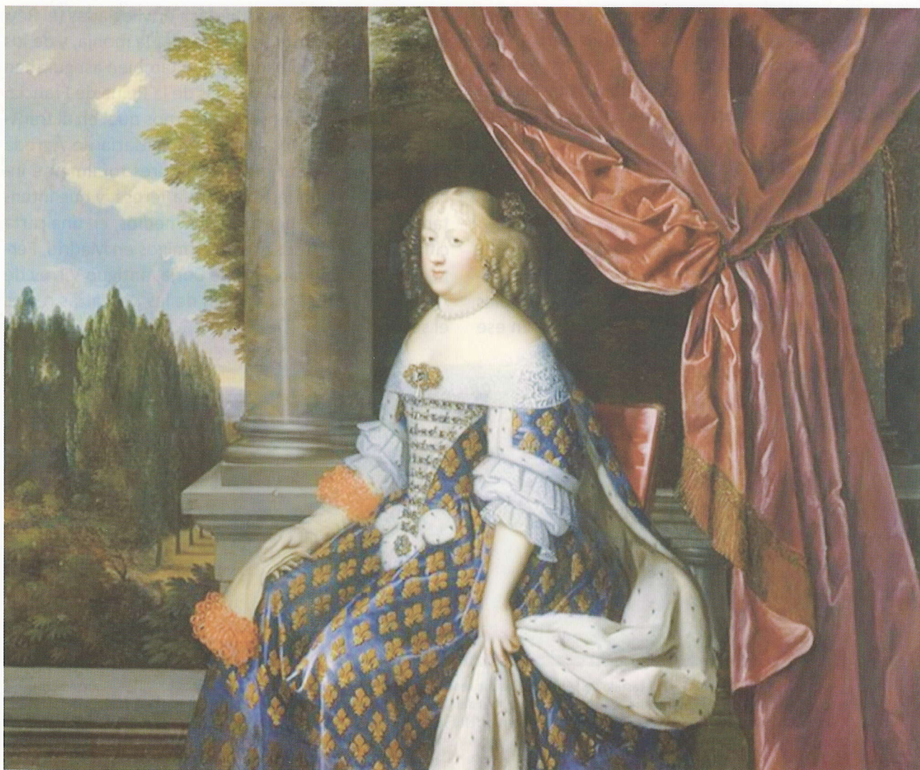
Jean Nocret, María Teresa en Reina de Francia, ca 1660 (óleo sobre lienzo, castillo de Versalles, 148 X 177 cm).

Algunas características del lenguaje empleado permiten comprender el auténtico alcance de este