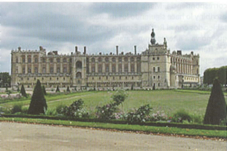
El castillo de Saint-Germain-en-Laye.

Desde este lugar propicio a la organización de grandes cacerías reales, María Teresa escribe a María de Ágreda durante el verano 1662 (carta [22]).