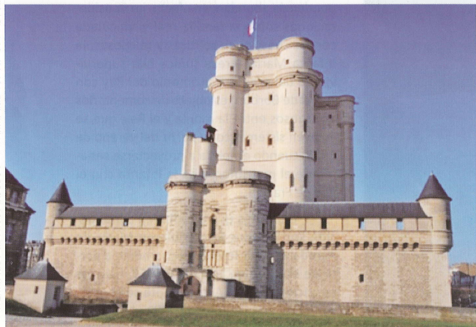
El castillo de Vincennes, a las afueras de París.

siones imperiales de cada país en su intento de dominar militarmente el resto del continente europeo (desde Portugal a Flandes, incluyendo Italia, Borgoña, los distintos reinos de Alemania, etc.), para ejercer también la forma de preeminencia espiritual heredada del modelo imperial, que tanto el Rey católico de España como el Rey cristianísimo de Francia podían aspirar a encarnar. Contra ese modelo imperial, María de Ágreda no cesa de mediar como abogada de la reconciliación entre ambas monarquías católicas. En el momento en que se empiezan las gestiones concretas para la Paz de los Pirineos, funda la urgencia de la paz sobre la necesaria unión de los reyes católicos para el bien común de todos los pueblos. Al Rey Felipe IV, le escribe: «Le suplico mire y considere V. M. el estado de la Cristiandad, que es miserable, terrible y afligido, por-