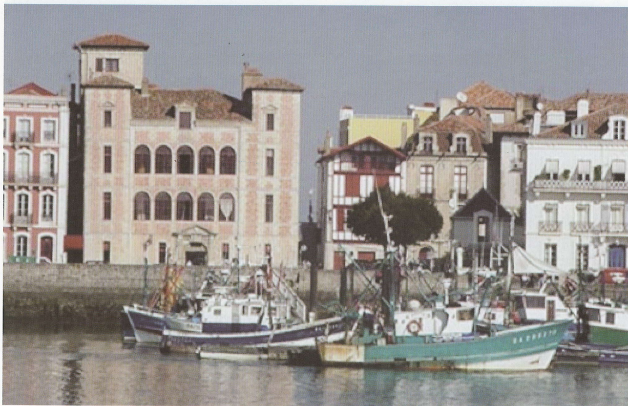
La Casa de la Infanta, en el puerto de San Juan de Luz. María Teresa reside en este palacete durante las festividades de su boda con Luis XIV, en junio 1660.

No se puede conocer con certeza el grado de relación personal que pudo existir entre María Teresa y María de Ágreda antes de 1659. Sabemos que, en sus oraciones, la monja asociaba la Infanta a su hermano, el Príncipe Baltasar Carlos, muerto en 1646 (véase nota 30 a la carta [2]). En el convento de Ágreda se sigue conservando, hoy en día, un precioso retrato (52 x 48 cm) de la Infanta María Teresa, pintado en el taller de Velázquez hacia 1652, cuando la