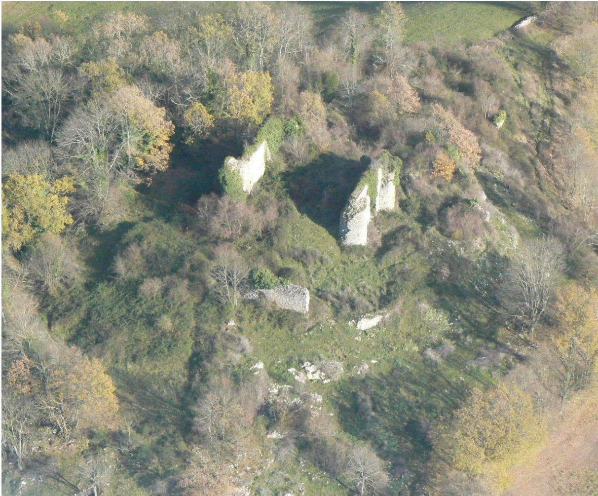
Fig. 3 : Le castrum de Montesquieu-Avantès.

Les deux sites tiennent une place de choix en rapport direct avec le réseau viaire qui les a précédé : Montesquieu occupe un des premiers reliefs couseranais quand on vient de l'Arize par la voie antique ; et Lescure, sur une position moins forte, est au contact direct du chemin de serre qui, depuis Montesquieu, se dirige vers le Séronais, et autour duquel s'organise l'habitat 26 .