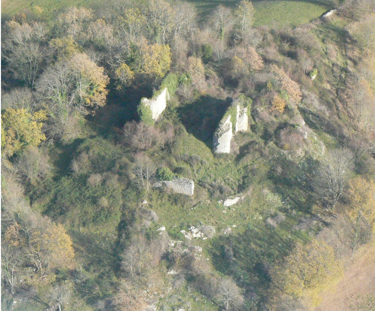
Fig. 3 : Le castrum de Montesquieu-Avantès.

Les deux sites tiennent une place de choix en rapport direct avec le réseau viaire qui les a précédé : Montesquieu occupe un des premiers reliefs couseranais quand on vient de l'Arize par la voie antique ; et Lescure, sur une position moins forte, est au contact direct du chemin de serre qui, depuis Montesquieu, se dirige vers le Séronais, et autour duquel s'organise l'habitat 26 .