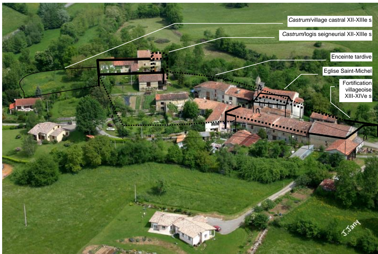
Fig. 2 : restitution des fortifications de Lescure

Il est donc manifeste que la division de l'Avantès en une seigneurie ecclésiastique, une seigneurie vassale et un domaine restant relevant directement du comte, procède de son autorité. Il est aussi probable qu'elle fut synchrone avec la fondation de l'abbaye et donc consécutive à la prise en main du Couserans par Bernard de Comminges vers 1130.