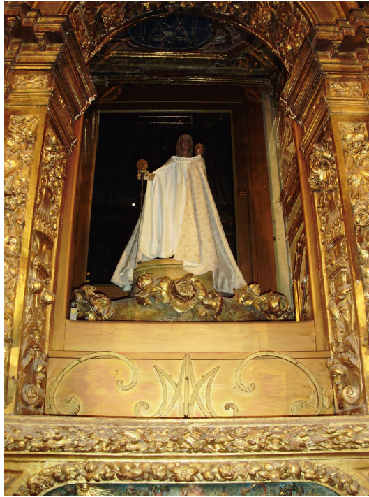
La « Vierge gardienne » de l'ermitage de Notre-Dame de Font-Romeu

XIII e siècle qui n'a jamais été réputée miraculeuse (illustration n° 3). Jusque dans les années 1950, cette statue et la Vierge de l'Invention occupèrent tour à tour la même place dans l'église d'Odeillo : une niche située au centre du retable du maître-autel. Mais la Vierge de l'Invention l'occupait, comme on l'a dit, entre le 8 septembre et le dimanche de la Trinité, donc durant la majeure partie de l'année. Or, durant la même période, la Vierge d'Odeillo était placée dans le retable de la chapelle située à gauche du maître-autel 9 . Cette situation faisait apparaître la Vierge d'Odeillo comme ayant un rang inférieur à celle de Font-Romeu, voire comme un simple substitut puisqu'elle venait remplacer celle-ci au-dessus du maître-autel quand elle était dans son ermitage. C'est peut-être pour éviter cette hiérarchisation que le clergé local, dans les années 1950, réserva à Notre-Dame d'Odeillo la niche au-dessus du maître-autel, place qu'elle occupe toujours durant toute l'année, et à la Vierge de Font-Romeu, celle de la chapelle latérale. Cependant, à la fin de la procession qui l'amène de son ermitage à l'église, le 8 septembre, on la dépose au centre de la nef de façon à ce que les pèlerins puissent venir baiser son manteau avant qu'elle soit placée dans sa niche.