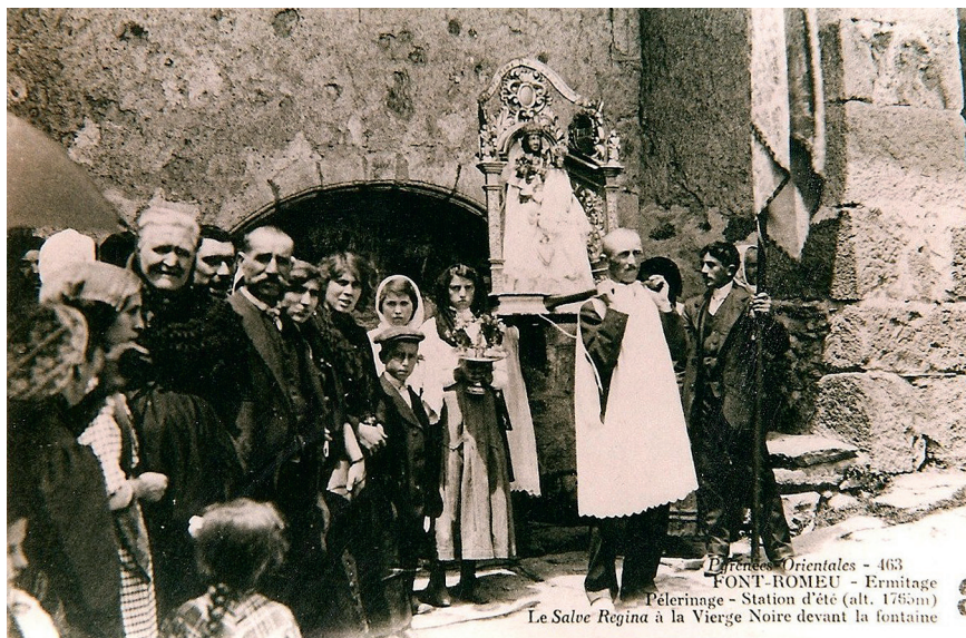
Différences Orientales - 463 FONT-ROMEU - Ermitage Pèlerinage - Station d'été (alt. 1765m) Le Salve Regina à la Vierge Noire devant la fontaine

La « vraie » statue de Notre-Dame de Font-Romeu devant son ermitage, le jour de sa fête (début XX e siècle)