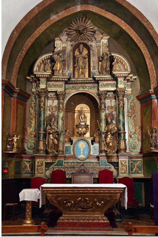
Notre-Dame d'Odeillo au centre du retable du maître autel de l'église Saint-Martin d'Odeillo

Il en allait du moins ainsi en 1994, année où j'ai participé à la Baixá . Tout au long de cette journée, j'ai systématiquement demandé aux pèlerins avec qui j'ai pu parler quelle était l'identité des statues en jeu : celle que l'on avait déposée sur des brancards devant la porte de l'ermitage était-elle la Vierge de l'Invention ? Une autre allait-elle prendre sa place dans l'ermitage ? Qu'en était-il de la Vierge d'Odeillo ? La plupart de mes interlocuteurs ne s'étaient, visiblement, jamais avisés qu'il pouvait y avoir plusieurs statues ; certains ignoraient même l'existence de la Vierge d'Odeillo. Un homme, parmi ceux qui la connaissaient, m'expliqua que celle-ci est plus ancienne que la Vierge de l'Invention (ce qui est tout à fait exact) et il ajouta : « La Vierge d'Odeillo a remplacé Notre-Dame de Font-Romeu à l'époque où celle-ci avait été enterrée pour la mettre à l'abri des Cathares ». La Vierge d'Odeillo aurait donc été, avant son invention, un substitut de la Vierge de Font-Romeu. Cette affirmation traduit, à mon sens, l'inégale valeur dévotionnelle attachée aux deux statues, inégalité que manifestait avant les années 1950, comme on l'a vu, leur place respective dans l'église d'Odeillo.