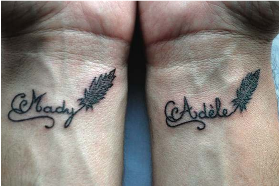
Tatouage réalisé par un homme pour ses jumelles décédées.