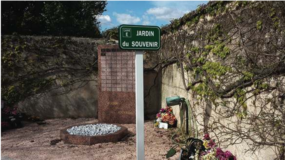
« Jardin des souvenirs » où sont dispersées les cendres des fœtus de plus de 22 SA provenant de la maternité A.