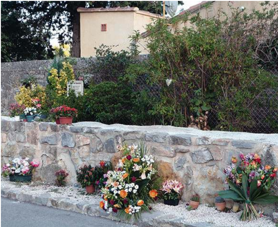
« Jardin des souvenirs » où sont dispersées les cendres des fœtus de moins de 22 SA, ainsi que les cendres des « pièces anatomiques » de l'hôpital A.

d'ouverture du crématorium. Les cendres sont ensuite dispersées dans le « jardin du souvenir » du cimetière attenant au crématorium.