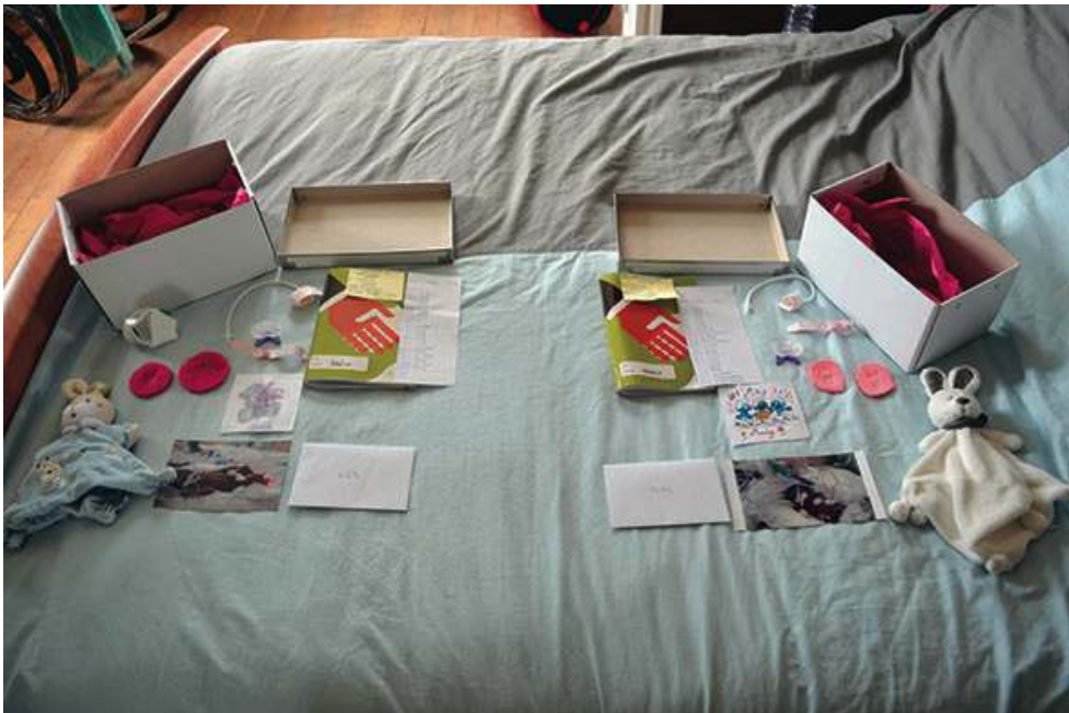
Boîtes souvenirs données par l'hôpital peu de temps après le décès de jumelles, nées prématurées à 24 SA ou 22 semaines de grossesse, et décédées peu de temps après la naissance.