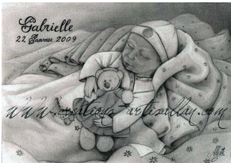
Portrait de Gabrielle, décédée à 5 mois de grossesse, suite à une interruption de grossesse (IMG) pour cause de malformations fœtales (anencéphalie)