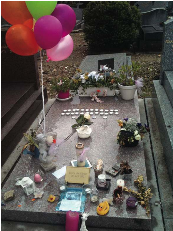
Tombes de mort-nés, ceints de barreaux de berceau et décorées de nombreux jouets pour enfants