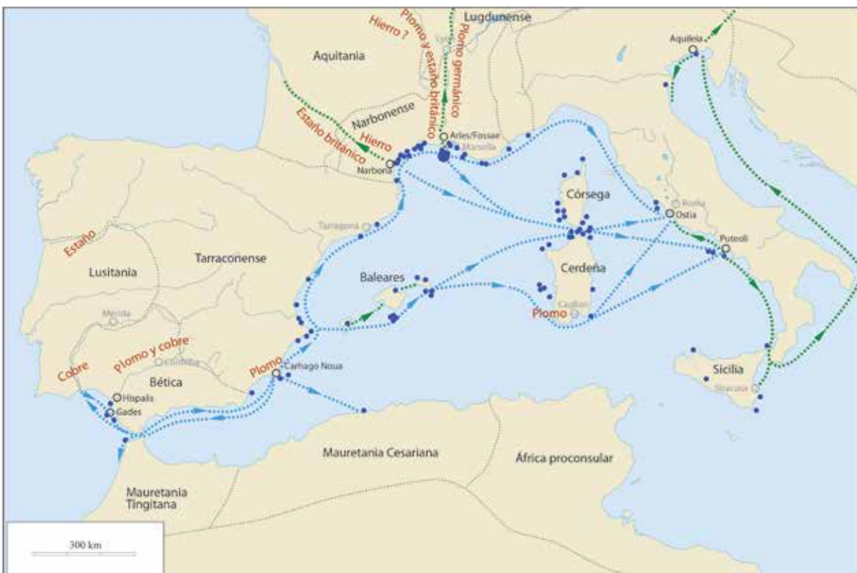
Figura 2. Las grandes rutas del comercio romano de los metales. En verde: itinerarios marítimos y terrestres de redistribución.

Según el dicho, todas las rutas conducen a Roma. Sin duda el dicho se verifica perfectamente para el comercio de los metales. Más que los hallazgos terrestres, escasos como se ha visto, las rutas que dibujan los distintos lugares donde aparecieron lingotes de metal apuntan hacia un comercio en parte dirigido a Roma, y a Italia de forma general, en parte también dirigido a la Europa continental (Domergue/Rico, en prensa-a) (Fig. 2). De la península ibérica (Domergue/Rico, en prensa-b) partían dos grandes rutas, una más bien costera, la otra de alta mar. El recorrido de la primera, pasando por Denia, era la vía normal hacia los puertos galos, Narbona y Fos-Arles, y fue, en la época altoimperial, el eje habitual por el que el cobre hispánico se dirigía hacia los mercados galos. La segunda, apoyándose en el archipiélago balear, conducía en vía directa hacia los puertos itálicos de Puteoli y Ostia por el célebre estrecho de Bonifacio. Rutas alternativas existían, como la seguida por el mercante Mal di Ventre C hundido con su imponente cargamento de plomo de Carthago Nova cerca del islote del mismo nombre. Los datos son insuficientes para determinar en qué medida esta ruta pudiera ser utilizada con regularidad si bien otros hallazgos ( Mal di Ventre A –s. I a.C.– y B –s. I d.C.–) atestiguan su uso. Tampoco se puede descartar que el navío tuviese otro destino que el puerto campano de Puteoli y no pretendiera alcanzar directamente algún puerto siciliano.