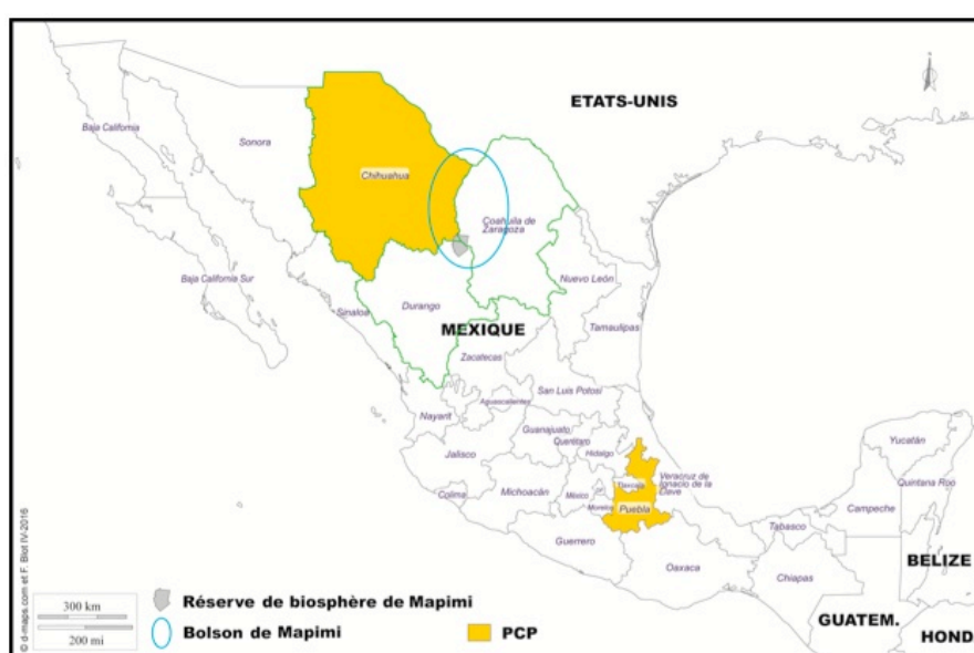
Figure 1 - Carte de localisation des terrains d'étude du Programme PCP et du Bolson de Mapimi

L'analyse des discours et des pratiques repose sur l'étude de documentations institutionnelles et scientifiques, sur la politique de conservation et tout particulièrement sur les réserves de biosphère au Mexique, des observations directes et participantes lors de réunions organisées dans la réserve et sur des entretiens compréhensifs conduits entre 2014 et 2016 auprès de scientifiques de l'INECOL et du CNRS, d'institutions et d'habitants dans l'espace de la réserve de biosphère de Mapimi ainsi qu'aux alentours proches dans le cadre de relations entre scientifiques Mexicains et Français ayant conduit à la réalisation d'un film sur les réserves de biosphère pour le compte de l'UVED.