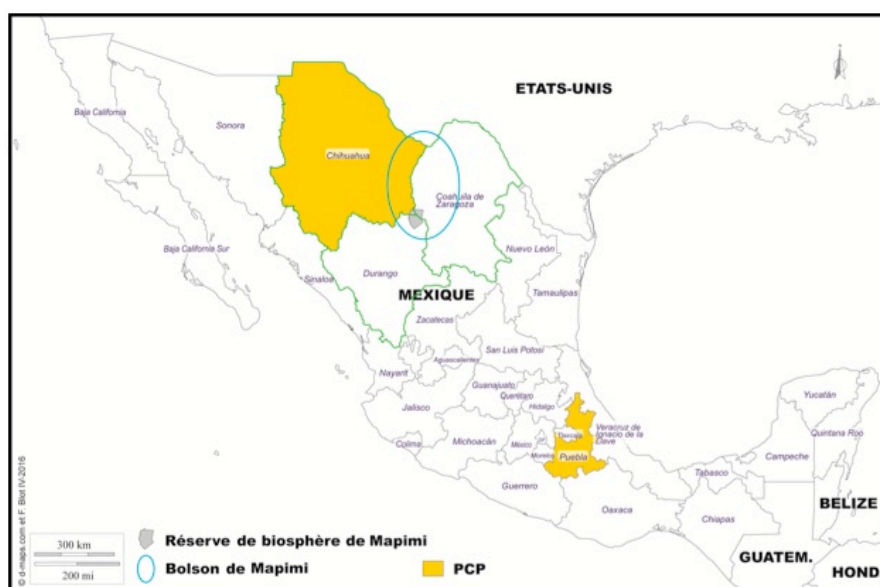
Figure 1 - Carte de localisation des terrains d'étude du Programme PCP et du Bolson de Mapimi

L'analyse des discours et des pratiques repose sur l'étude de documentations institutionnelles et scientifiques, sur la politique de conservation et tout particulièrement sur les réserves de biosphère au Mexique, des observations directes et participantes lors de réunions organisées dans la réserve et sur des entretiens compréhensifs conduits entre 2014 et 2016 auprès de scientifiques de l'INECOL et du CNRS, d'institutions et d'habitants dans l'espace de la réserve de biosphère de Mapimi ainsi qu'aux alentours proches dans le cadre de relations entre scientifiques Mexicains et Français ayant conduit à la réalisation d'un film sur les réserves de biosphère pour le compte de l'UVED.