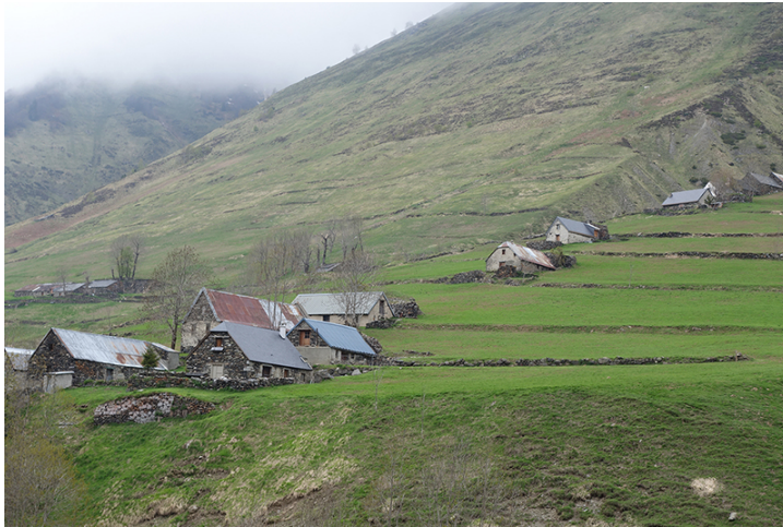
L'affirmation paysagère.