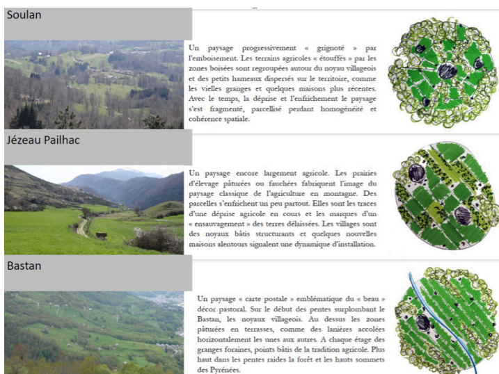
Planche I. Les paysages de nos terrains d'étude