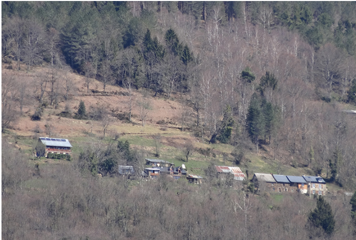
L'arrangement/réarrangement paysager.