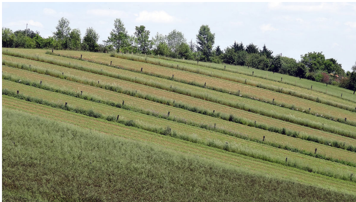
Figure 1. Chez François, printemps 2015, Montesquieu-Volvestre.

L'agroforesterie n'est pas qu'un outil de l'aménagement du territoire. Elle est aussi une action possible pour inventer et donner les orientations des lieux de vie de demain. Elle représente et symbolise cette agriculture génératrice de « formes paysagères » (Luginbühl, 2012) remarquables. Quand l'agroforesterie est intraparcellaire, elle permet la création « d'unités agrophysionomiques » (Deffontaines et al. , 1996) et la reconstruction d'une physionomie des territoires de l'agriculture, diversifiée, moins uniforme, offrant d'autres possibilités esthétiques ou le retour à des formes plus connues comme le pré-verger. Quand l'agroforesterie concerne les bords de parcelles et la plantation de haie, elle permet la re-création de formes bocagères plus emblématiques et mieux connues qui réhabilitent - aux regards de la société - un bocage « célèbre » et apprécié. Ces pratiques agroforestières en développement sont, semble-t-il, au cœur d'un renouveau des liens aux paysages agricoles (fonctionnel, patrimonial, affectif, esthétique) qu'il faut associer à l'évolution des pratiques sociales de territoire.