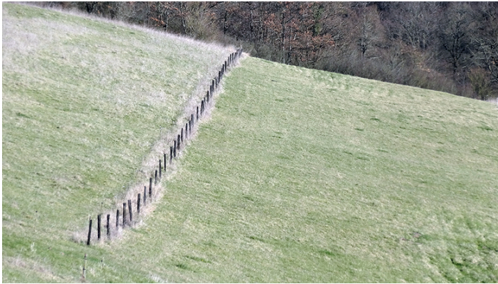
Figure 2. Chez Arnaud, hiver 2015, Mondilhan. Ligne d'arbres plantée en travers de la pente dans la prairie permanente. Elle conduit de l'espace ouvert au bois.

C'est précisément ce désir social contemporain de paysage que viennent questionner le Collectif Paysages de l'après-pétrole et la jeune agence INITIAL-Paysagistes avec la démarche « Quels paysages pour demain ? La campagne des paysages d'Afterres2050 3 ». Ce travail projette des scénarii innovants, pensant sans les dissocier la recomposition agricole avec les modes de vie souhaitables d'un monde postpétrole. Comme l'indique Odile Marcel (2016), cette pensée par le paysage permettrait, entre autres, de « jouir de l'aspect sensible des aménagements agricoles ». Le paysage joue alors un rôle particulier dans les nouvelles manières d'habiter les territoires. Dans ce cadre, notre travail pose l'hypothèse que le paysage influence aussi l'engagement agroforestier de l'agriculteur. La recherche exploratoire veut pouvoir comprendre et expliquer les positionnements paysagers de chacun.