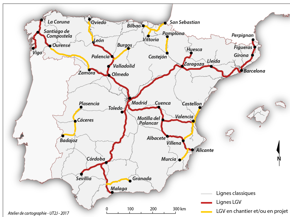
Fig. n° 4. Le réseau ferroviaire espagnol de lignes à grande vitesse en 2017

offre un nouveau débouché méditerranéen à Madrid et la seconde est la première étape de la grande vitesse en Galice avec la LGV La Coruna – Ourense, section qui n’est pas encore rattachée au réseau de LGV, mais qui le sera sans doute en 2020. En 2015, 3 lignes sont ouvertes dans l’ouest de la péninsule ibérique, Valladolid – Zamora, Valladolid – Leon et Vigo – Santiago de Compostela rattachée à la LGV La Coruna – Ourense.