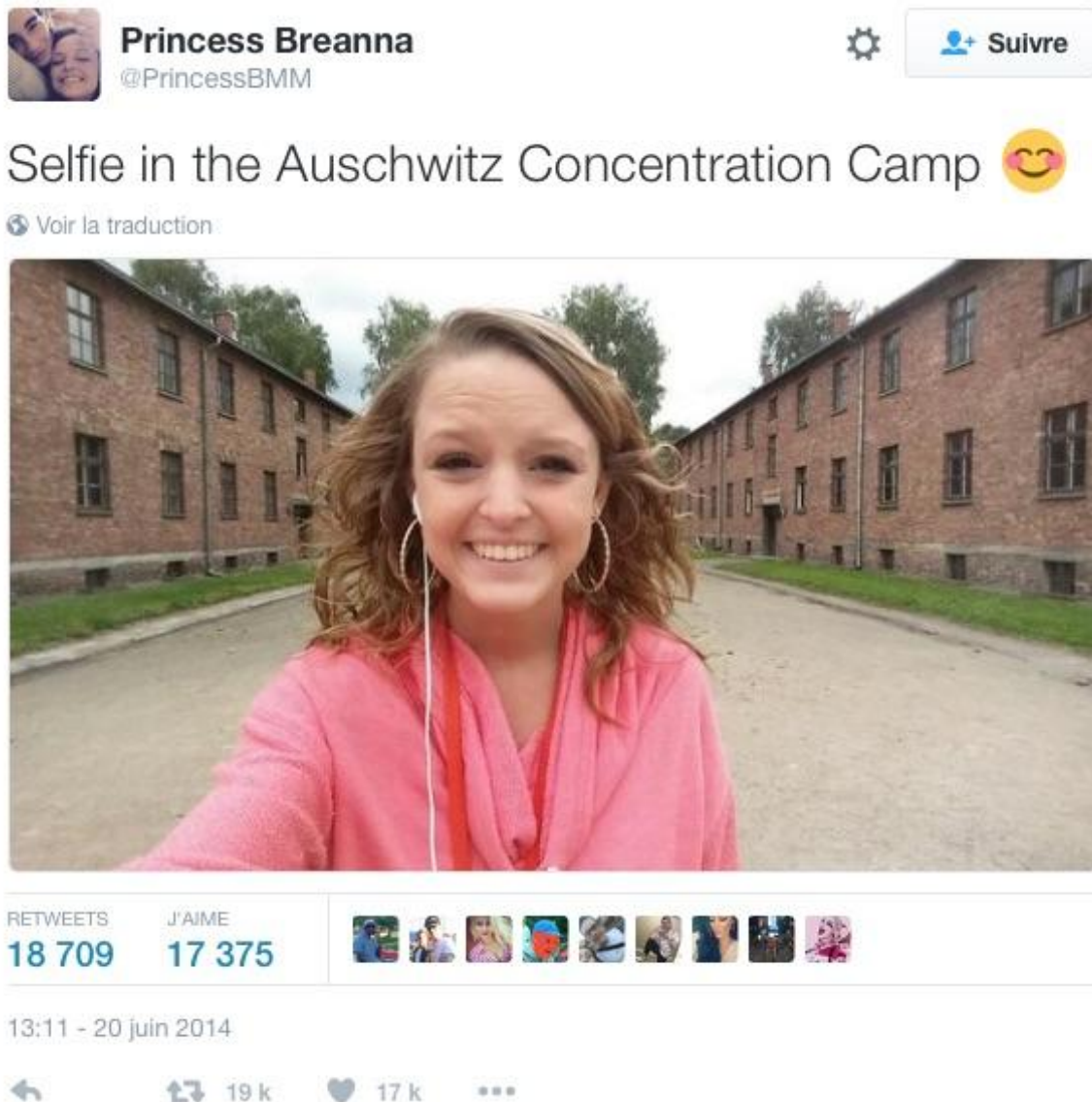
Figure 6 : Selfie posté sur les réseaux sociaux