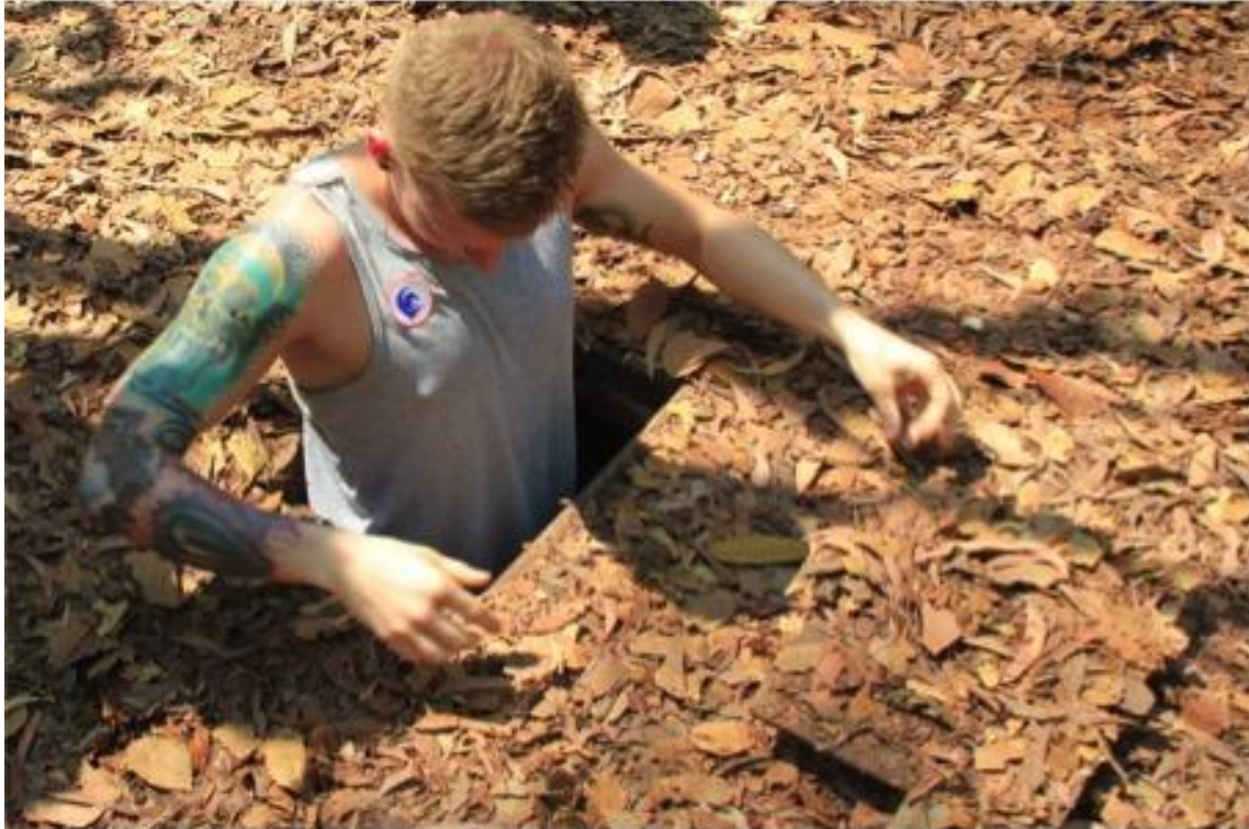
Figure 4 : Expérimentation des tunnels de Cu Chi par les touristes