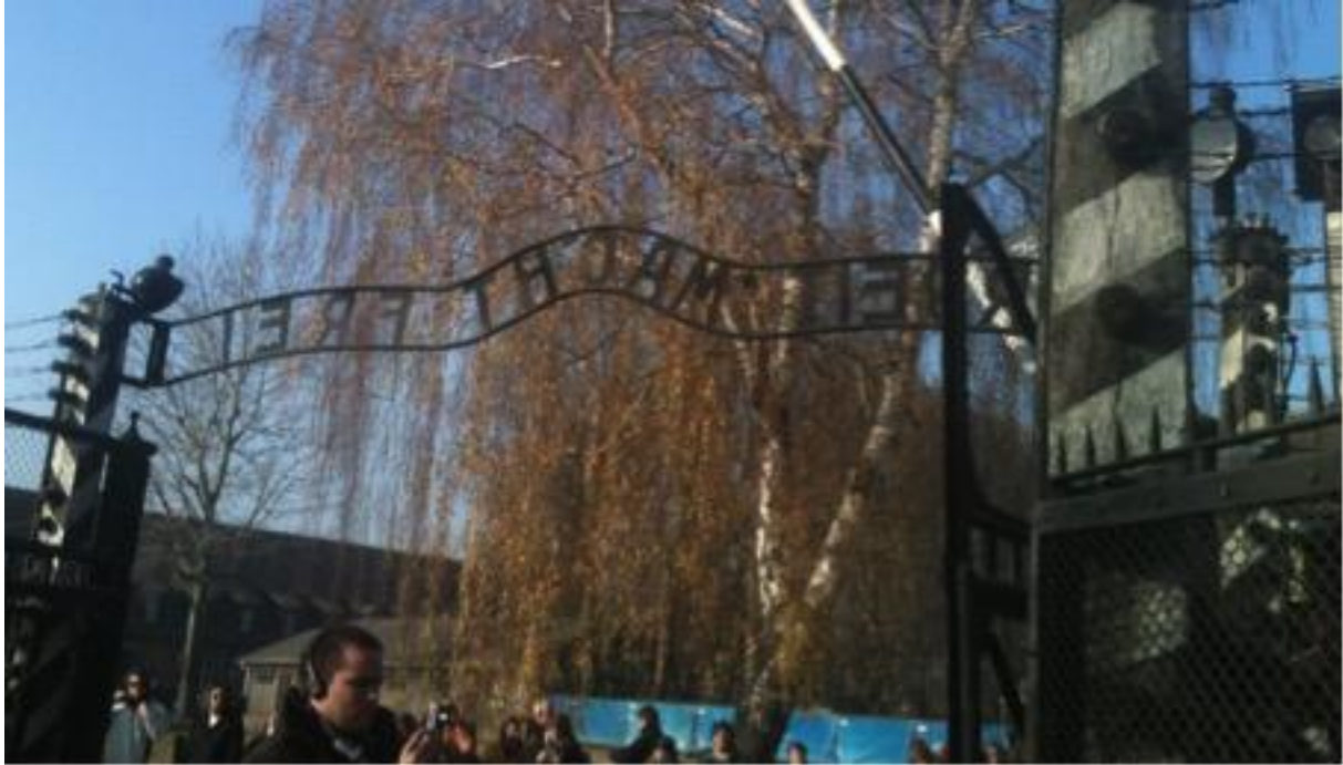
Figure 1 : Entrée d'Auschwitz avec son fameux portail « Arbeit macht frei »

Cliché : Dominique Chevalier, novembre 2011.