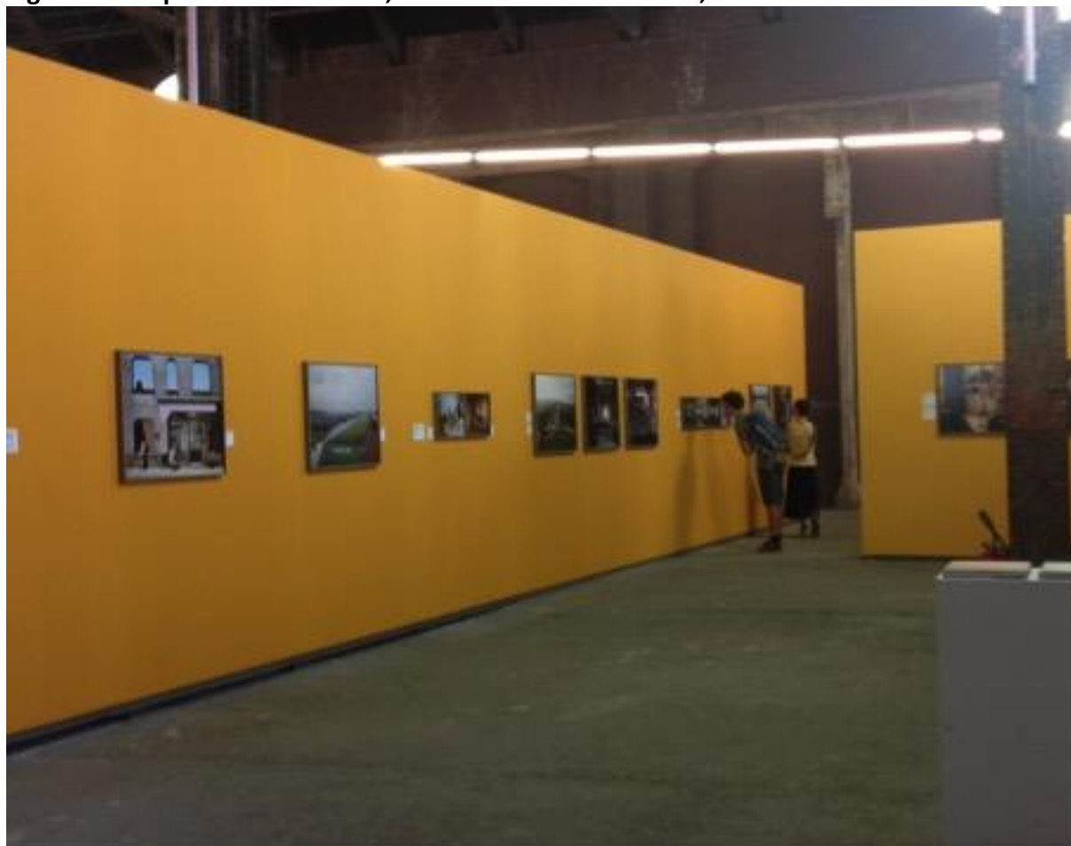
Figure 10 : Exposition I was here , tourisme de la désolation, Rencontres d'Arles

Cliché : Dominique Chevalier, août 2015.