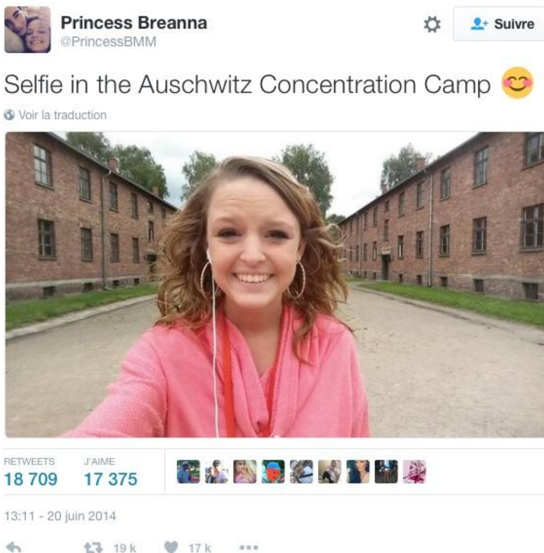
Figure 6 : Selfie posté sur les réseaux sociaux