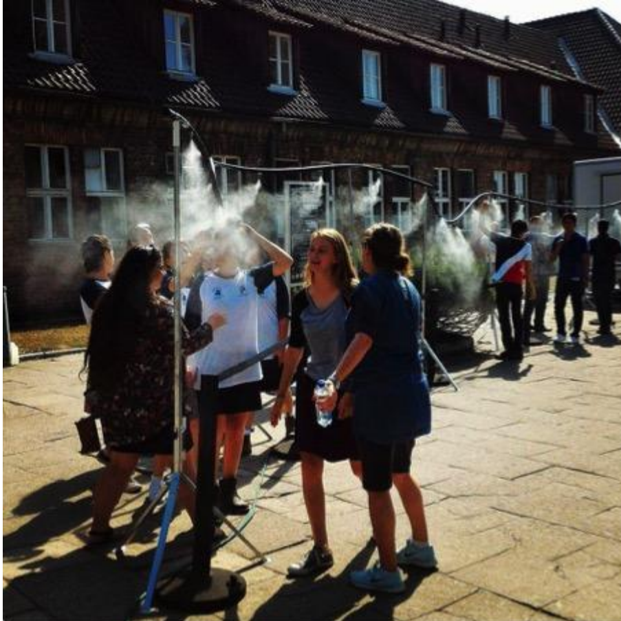
Figure 7 : Brumisateurs/douches installés à Auschwitz