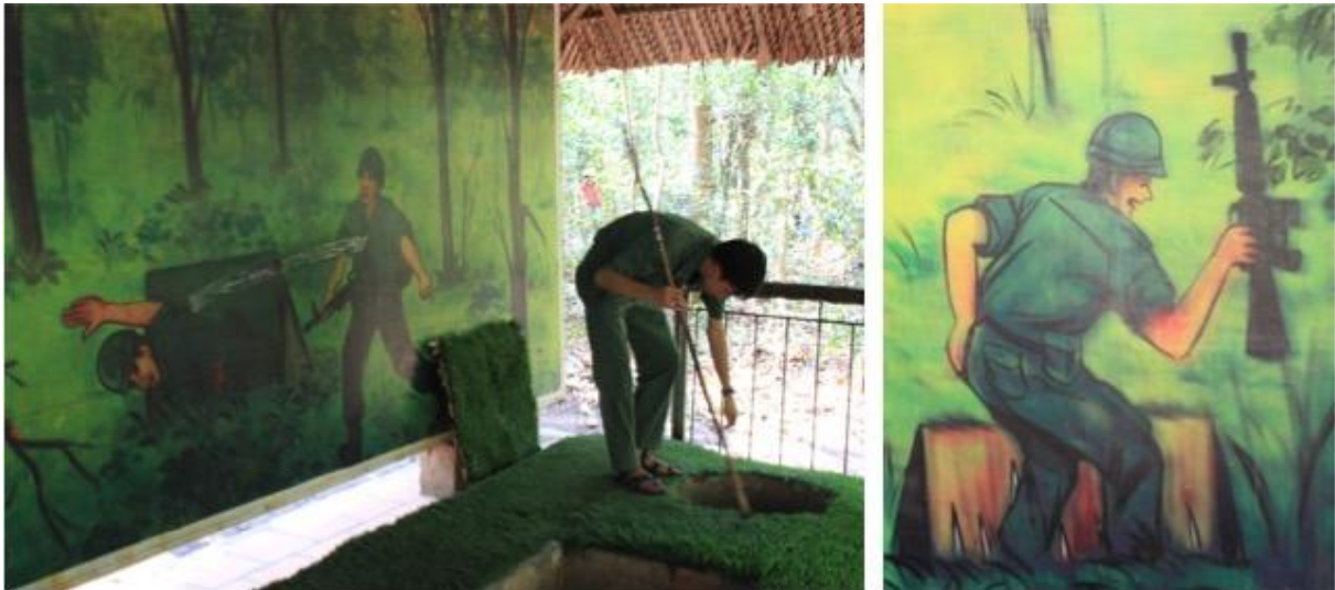
Figure 5 : Démonstration du fonctionnement des pièges et illustrations peintes sur les murs