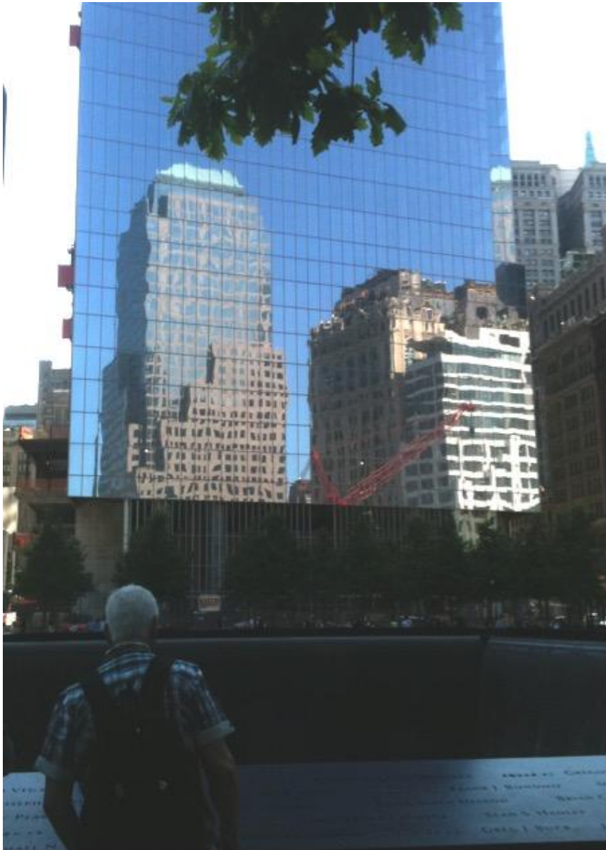
Figure 9 : Touriste devant l'inscription des Noms du mémorial Reflecting Absence . Site du Mémorial du 9/11. New York