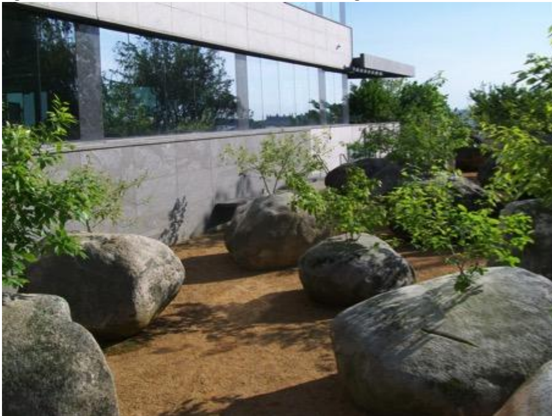
Figure 3 : Jardin de Pierres, Museum of Jewish Heritage, New York

Cliché : Dominique Chevalier, janvier 2008.