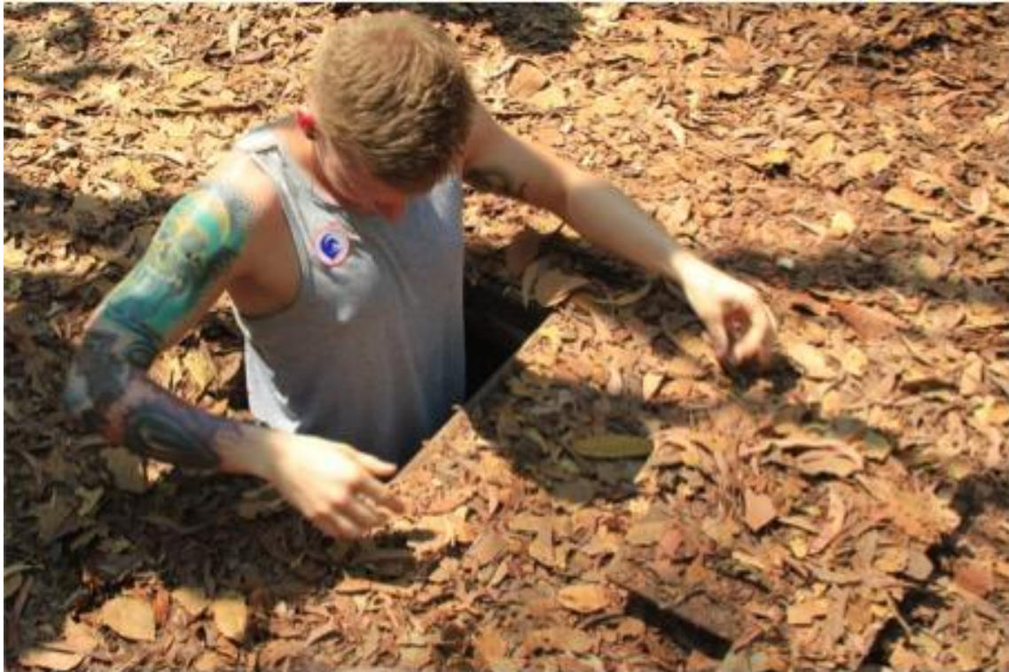
Figure 4 : Expérimentation des tunnels de Cu Chi par les touristes