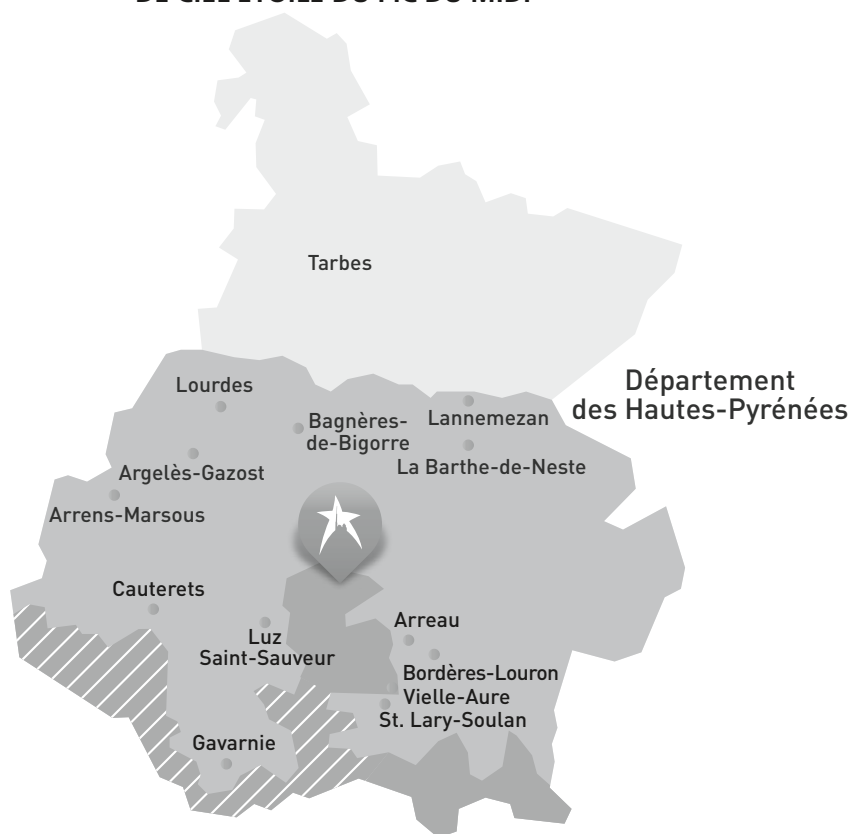
Figure 3.1 – CARTOGRAPHIE DES DIFFÉRENTES ZONES DE LA RÉSERVE INTERNATIONALE DE CIEL ÉTOILÉ DU PIC DU MIDI