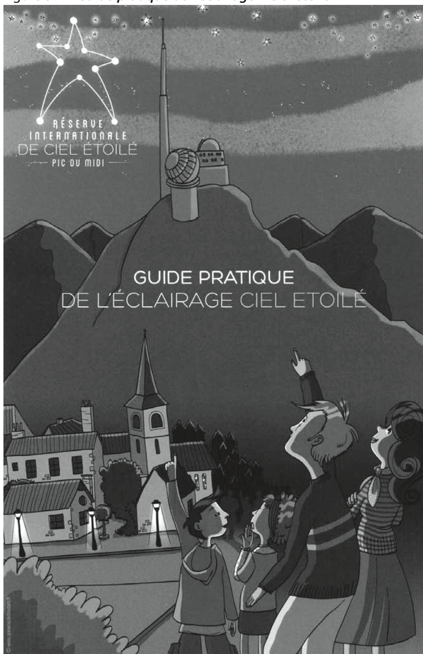
Figure 3.4 – Guide pratique de l'éclairage – Ciel étoilé