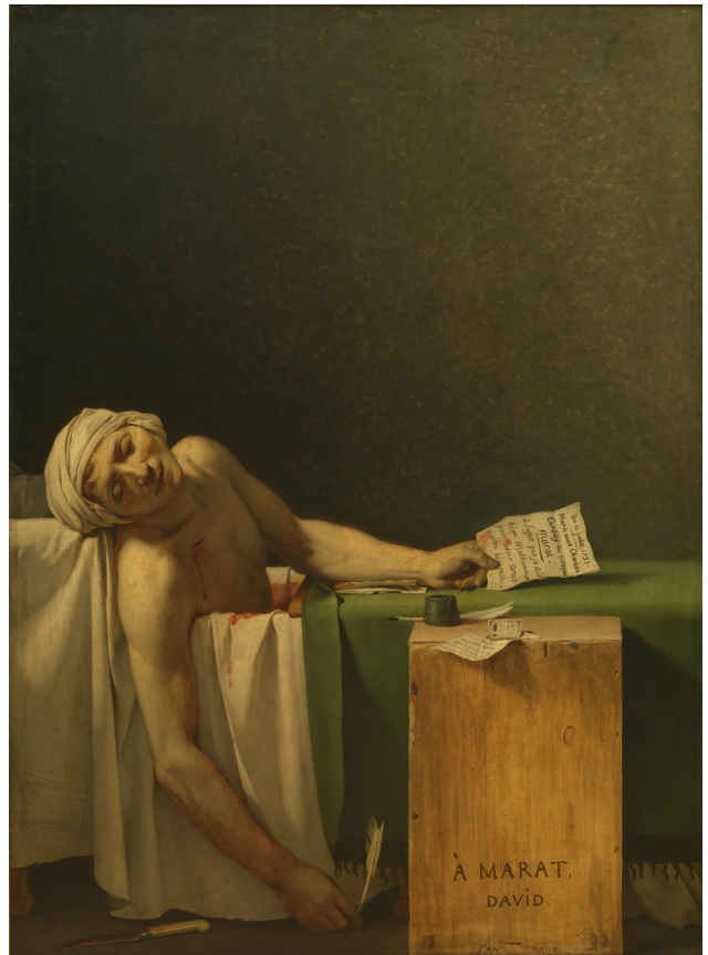
Figure 1 : Jacques-Louis David, Marat assassiné , 1793, Bruxelles, musées royaux des Beaux-Arts de Belgique, huile sur toile, 165 x 128 cm, inv. 3260.

Il ordonne aux manufactures des livraisons, qu'il ne solde d'ailleurs que rarement 26 .