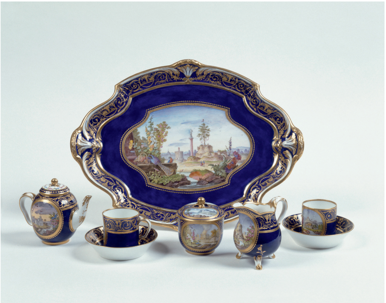
Figure 4 : Edmé-François Bouillat (peintre), Pierre-Jean-Baptiste Vandé (doreur), Déjeuner tête-à-tête de six pièces , Vizille, musée de la Révolution française, porcelaine de Sèvres.

d'État] destruction; fabriquez, disait-on, des tapisseries dont le prix diminue par le rétrécissement des dimensions, par l'économie dans le choix des sujets, dans les richesses d'exécution et auquel les maisons et les fortunes ordinaires puissent atteindre. Faites, disait-on encore, des porcelaines moins parfaites, moins riches en ornements, faites de la porcelaine commune, faites des imitations de la terre anglaise. C'était substituer les tapisseries d'Aubusson aux tapisseries des Gobelins, et convertir la manufacture de porcelaine de Sèvres en une manufacture de faïence 32 . »