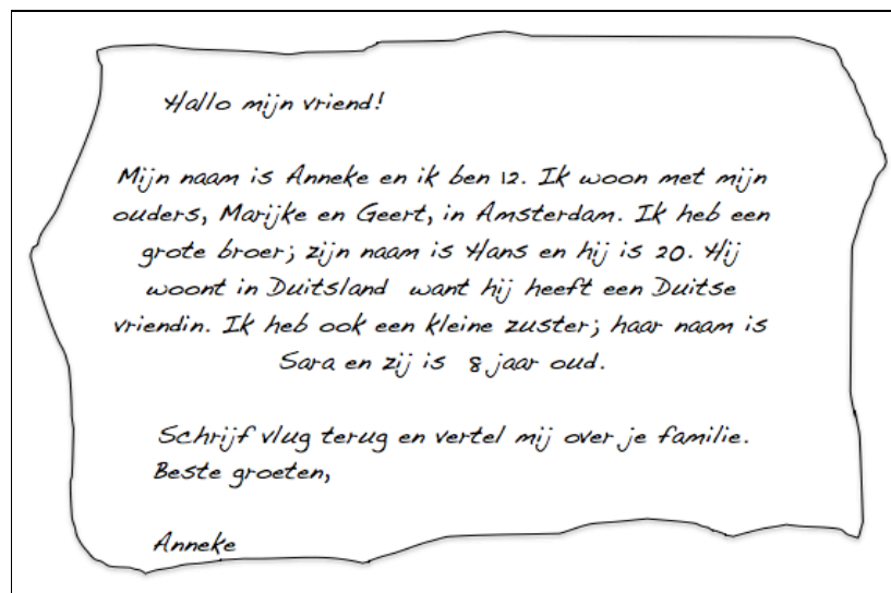
Figure 1 – Texte en néerlandais

Trois textes abordant des sujets habituellement travaillés en cours de langue furent soumis aux élèves. Les textes ont été proposés sans en indiquer la nature: nous avons ainsi cherché à neutraliser les effets des idées préconçues concernant les langues.