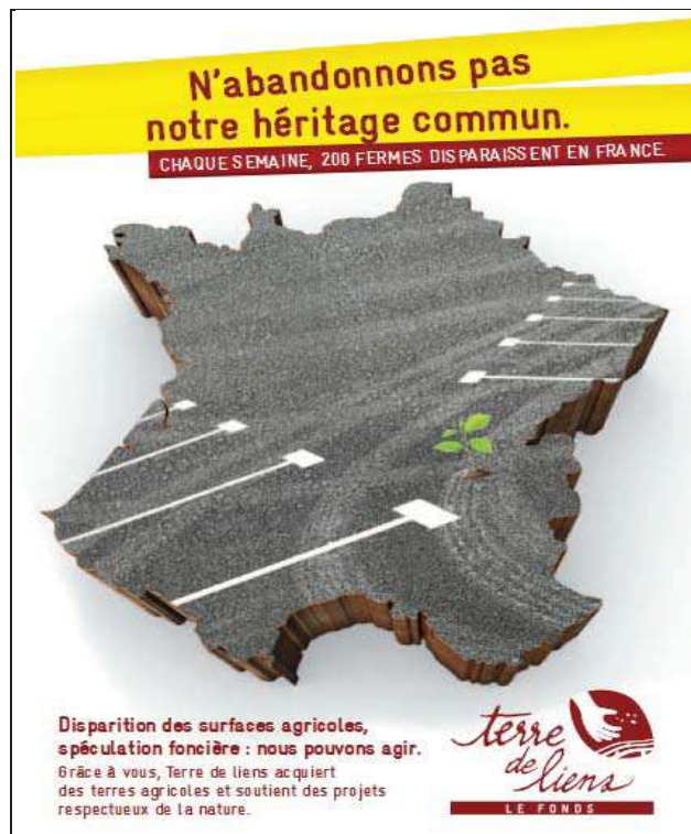
Figure 3 : Support de communication pour une campagne de collecte de don.